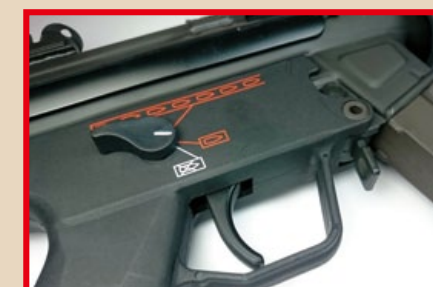
加大的扳機護弓，戴手套也可輕鬆操作。