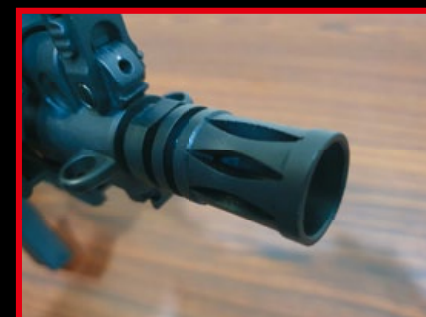
M4 規格的 14mm 逆牙防火帽可輕鬆拆卸下。

置、低電阻接線和可旋轉的 ProWin 型塑料腔室等，都是頂級改裝配件，玩家無須到處奔波找人安裝，E&C 就一次幫您搞定，而且 E&C HK416C 的上、下機匣、準星、防火帽和外管均為金屬製品，經過黑色陽極處理，具有良好的防腐性及耐磨性，握把和槍托則以塑料