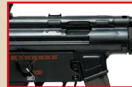
槍機拉柄固定在後，即可調整上旋組 (Hop-up)。