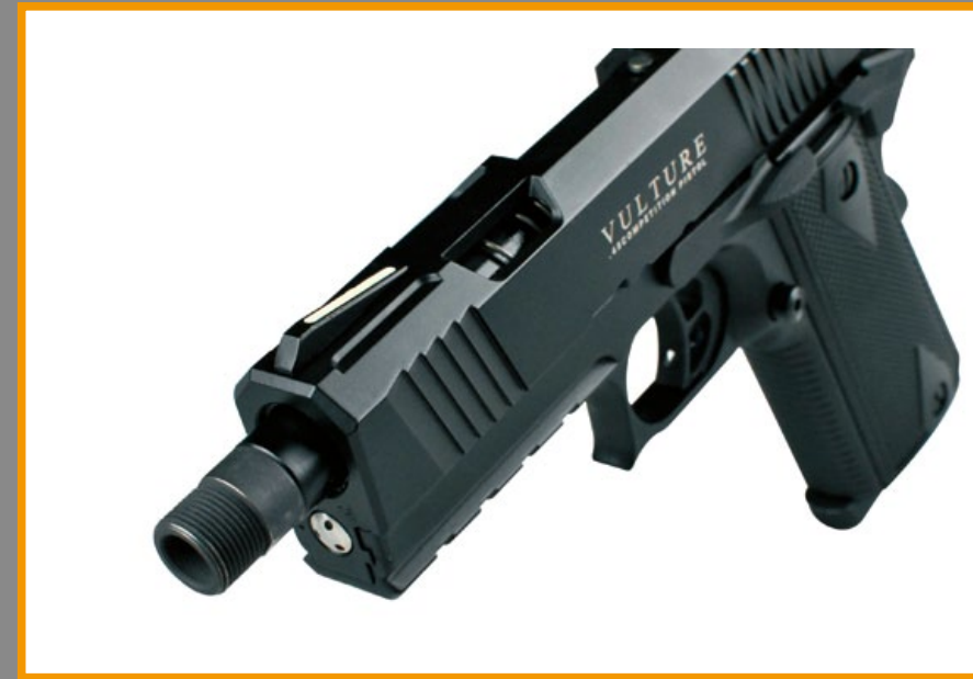
光纖準星前的槍口有 14 逆牙螺紋，可加裝滅音器。

一芝軒 (ICS) 在 2019 年曾跟德國寇斯 (Korth) 槍廠合作，聯手推出有「手槍中的藍寶基尼」之稱的複刻版 PRS 氣動手槍，結果這把外觀極為講究的 PRS 果然創下傲人的銷售記錄，ICS 受此激勵，決定繼續推出該槍的性能精進版名為「兀鷹」(Vulture) 的高品質瓦斯氣動手槍；該槍外觀承襲 PRS