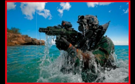
法國海軍突擊隊 (Commandos Marine) 持 HK416C 演習。

★ E&C EC-101 HK416C 全長：56~68cm(槍托伸展) 重量：2.85kg 內管長度：22cm 初速：100m/s(328fps) 彈匣容量：350發 上旋組(Hop-up)：可調