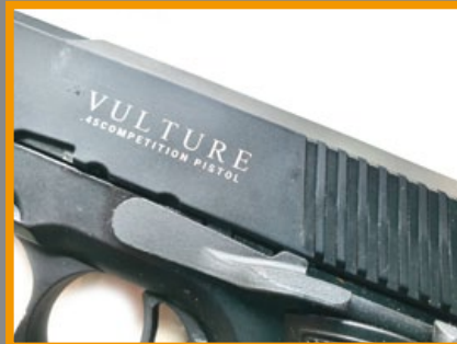
滑套左側表面印有兀鷹英文字樣。

一芝軒 (ICS) 在 2019 年曾跟德國寇斯 (Korth) 槍廠合作，聯手推出有「手槍中的藍寶基尼」之稱的複刻版 PRS 氣動手槍，結果這把外觀極為講究的 PRS 果然創下傲人的銷售記錄，ICS 受此激勵，決定繼續推出該槍的性能精進版名為「兀鷹」(Vulture) 的高品質瓦斯氣動手槍；該槍外觀承襲 PRS