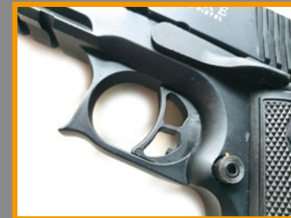
加大護弓內的鏤空扳機。