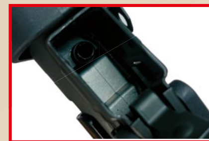
彈匣插槽口由金屬沖壓製成，不易變形。