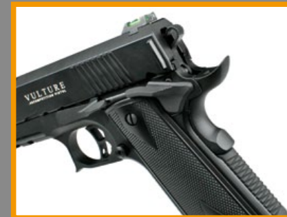
M1911 招牌式樣的河狸尾設計。