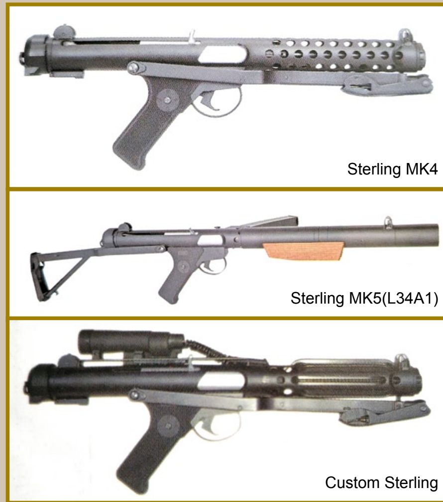
史特林系列除了 Mk7 之外，還包括 Mk4、Mk5 和客製星戰版等三種不同槍型 (由上至下)。

史特林系列的衍生型眾多，其中有一款將槍身縮短的史特林 Mk7 傘兵手槍 (Pare Pistol) 最具特色，分為可全自動與半自動射擊的軍用型，以及可半自動射擊的警用型兩種。在軍用型方面，又包括了 Mk7A4 及 Mk7A8 兩種型號，Mk7A4 具有 10.8cm 的短槍管，Mk7A8 則配備 19.8cm 的長槍管，同樣的，就只具有半自動射擊功能的警用型，則包