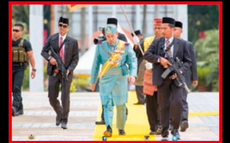
馬亞西亞吉蘭丹州的蘇丹穆罕默德五世的貼身保鏢所使用的 HK416C 及捷克蠟式 EVO 衝鋒槍