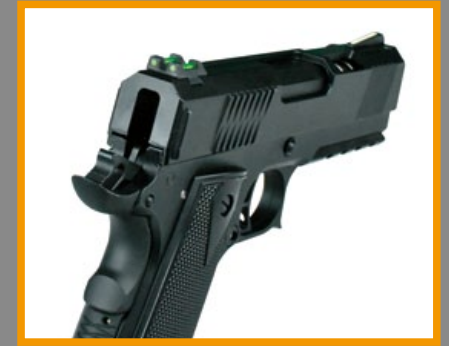
綠色光纖照門有助於精準射擊。