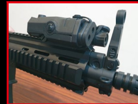
仿 PEQ-15 式樣的塑料雷指器，其實內部是電池存放空間。