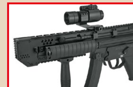
劍魚 A5 型裝有整合槍口制退器和戰術軌道的 RIS 護木。