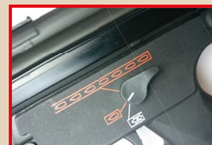
標準 MP5 式樣的火控組，分為單發、全自動射擊和保險三種模式。

★ 6mmProShop Swordfish A5 全長：46~68.7cm (槍托伸展) 總重：2.98Kg 內管長度：23cm 槍口初速：98~106m/s(320~350FPS) 彈匣容量：200發 上旋組 (Hop-up)：可調