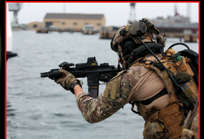
在北約“三叉戟交界 15 號”演習中使用 HK416 D10RS 的波蘭行動應變機動組成員。

◎文 / 蔡牧霖 · Text by Karl Tsai ◎感謝翔準國際 (AOG) 和東鶴 (E&C) 提供相關資料