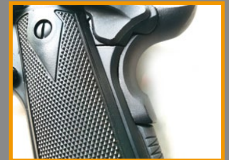
握把保險沿用 M1911 設計。

的精緻風格，以葛拉克 (Glock) 式樣的輕量化滑套，搭配柯特 (Colt)M1911 的框架，不但具備競技 (Competition) 特質，更成為紮實台灣技術結合優良德國工藝的終極展現。