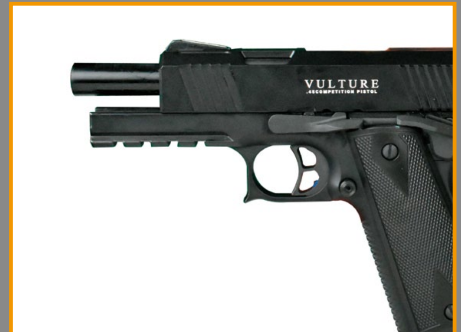
鋁合金製造的固定式槍管。

一芝軒 (ICS) 子品牌黑豹眼 (BLE) 推出的這把 BLE-011-SB 兀鷹 (Vulture) 氣動手槍，儘管不是實銃授權的複刻版，但 ICS 依舊以最接近實銃的加工技術來製作，重現 PRS 的絕佳內部構造和仿真外觀，局部鏤空的滑套前、後端刻有防滑肋紋，表面則有完整兀鷹英文刻印，搭配滑套降低阻力裝置，在射擊時的風阻極低！另外像是以硬質陽極氧化鋁合金製造的固定式槍管，不但強