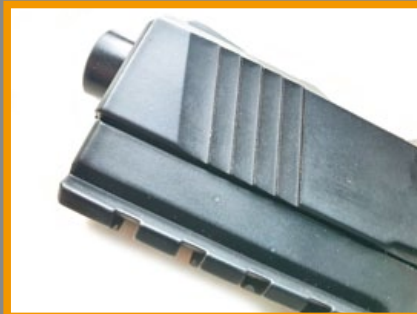
槍口裝有護蓋，滑套前端有防滑肋紋。