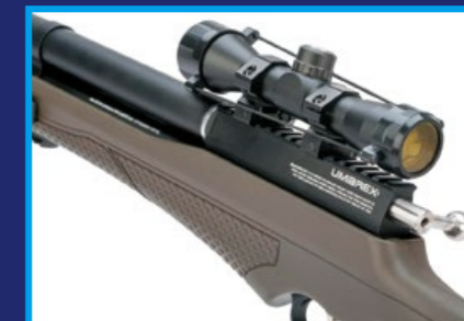
採用栓式步槍上膛，玩家可享受更多射擊樂趣。