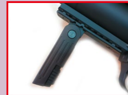
位於槍身下方的 MP7 式樣握把，可摺疊收納。