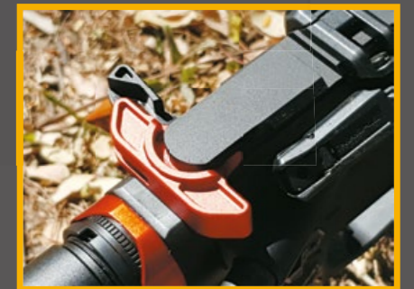
輕量化槍機拉柄助推器。