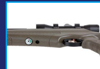
位於槍身下方的高壓空氣計量表。