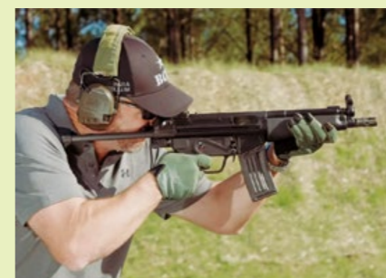
HK53 的性能良好，在民用市場也頗受歡迎。