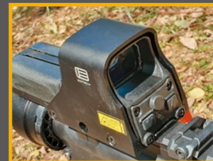
為了精確瞄準，換裝 EO-Tech 紅點鏡。