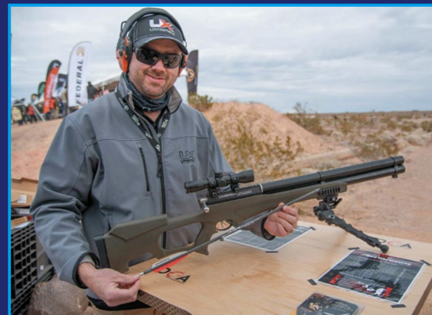
狙擊槍等級的動力箭槍，深獲歐美玩家喜愛。