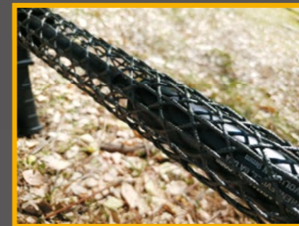
鋁合金加碳纖構成的環狀結構強度一流。