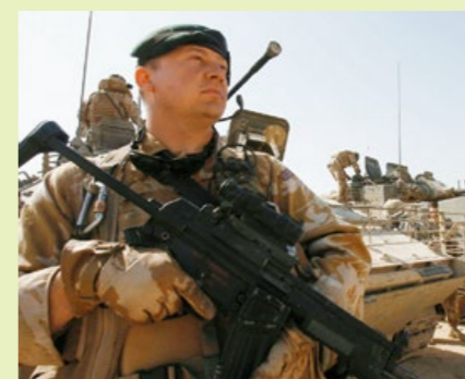
手持 HK53A3、在伊拉克南部值勤的英軍憲兵。