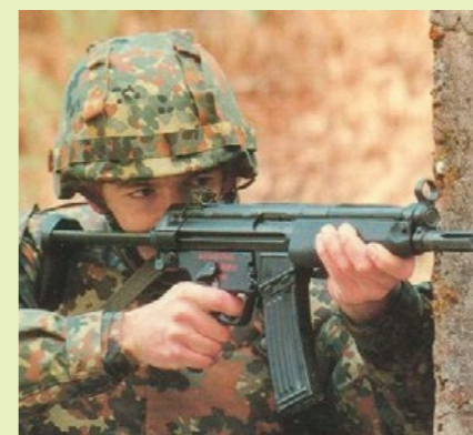
德軍並未採用 HK53，圖中所見僅是 HK 的工作人員。