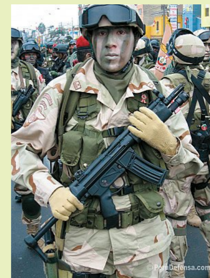
參加檢閱的秘魯傘兵，手持加裝槍燈的 HK53A2。(By weaponsystems.net)