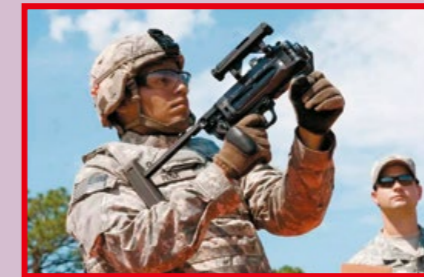
美軍操作單獨使用 (Stand-alone) 的 M320A1。