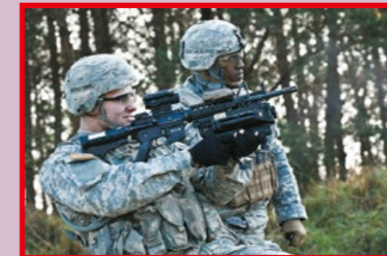
美軍士兵射擊裝在 M4A1 槍上的 M320A1。