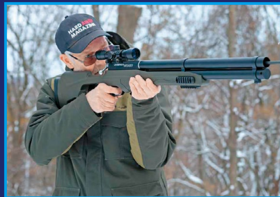
高壓動力箭槍使用壓縮空氣，對氣候變化敏感度不大。