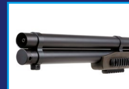
儲氣槽位於槍管下方，槍口可見箭體用隔板。