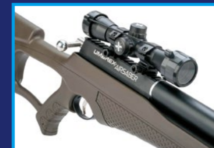
裝在軌道上的 Axeon Optics 4x32 狙擊鏡。