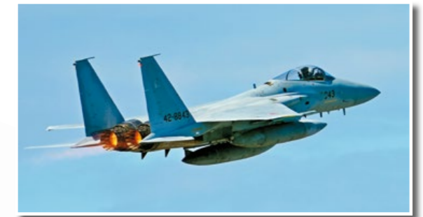
P82 軍事重演 Military Reenactment 沙漠風暴行動重演 The Reenactment of Operation Desert Storm