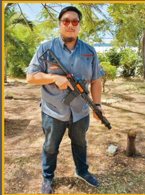
金剛會長和他自豪的 Brigand Arms AR-15。