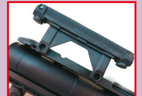
裝在槍身上方的裝飾性四分儀兼提把。