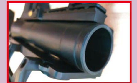
粗大的外管口徑為 40mm。