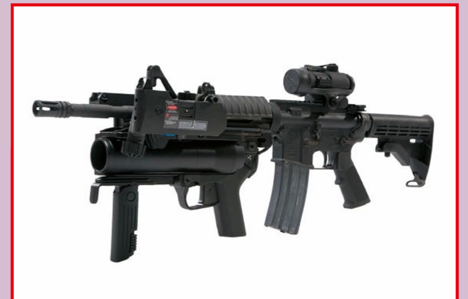
S&T 的 M320A1 搭配同公司 M4A1 電槍。