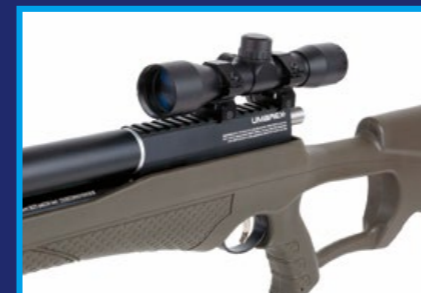
配置手槍型握把，握感與舒適度俱佳。