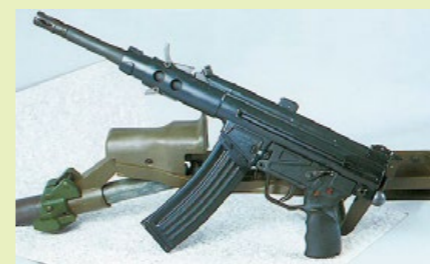
專為裝甲車士兵所設計的 HK53 MICV 射孔槍。

在 HK33 衍生的槍型中，HK53 可算是 HK33 的卡賓槍版本，長度比 HK33KEA3 更短，看起來就像放大版的 MP5，不過 Hk53 卻擁有突擊步槍的威力，所以既不算突擊步槍，亦不等同於傳統的衝鋒槍；衝鋒槍通常採用 9mm 手槍彈藥，HK53 雖然是發射理論上有效射程為 400m 的 5.56mm 步槍子彈，但槍管長度只有 21.1cm，加上初速較低，因此一般接戰範圍只在 200m