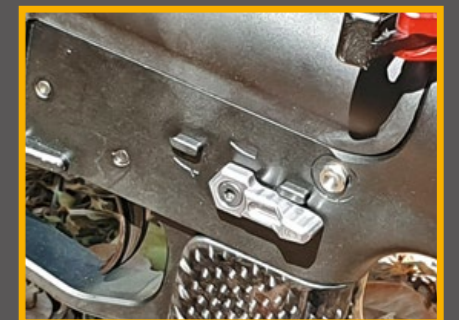
鋁合金打造的輕量化火控撥桿。

初見泰國國際防衛手槍 (IDPA) 的會長時，不禁對他的龐大壯碩身材留下深刻的印象，無怪乎大家都習慣稱呼他為“金剛”(King Kong)！由於野小子受訓的場地是泰國皇家空軍所