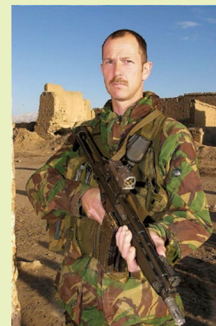
憲兵是英國陸軍中唯一使用 HK53 的單位。