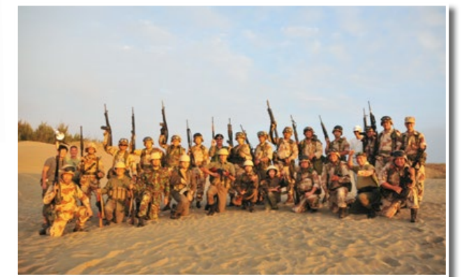
P94 生存菁英 Wargame Players 2021昆明軍事愛好者嘉年華 Military Fan Carnival 2021