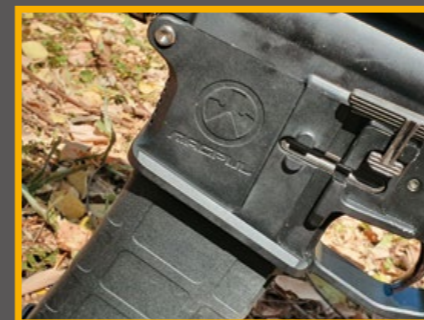
下機匣已改換為 Magpul 產品。