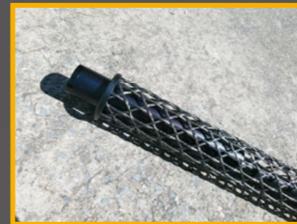
長度為 12 吋的破黑邊緣 (Edge) 護木。AR-15。