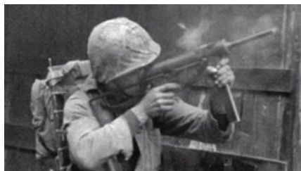
M3黃油槍服役歷史悠久，歷經二戰、韓戰、越戰，直至1991年波灣戰爭中尚有工兵駕駛配備M3A1衝鋒槍！

M3是全自動操作的衝鋒槍，多數的M3使用與湯姆森沖衝鋒槍同口徑的點四五手槍子彈(.45 ACP)，於1942年服役，M3由金屬片沖壓、點錒與焊接製造，縮短裝配工時。只有槍管槍機與發射組件需要精密加工；機匣是由兩片沖壓後的半圓筒狀金屬片焊接成一圓筒；前端是一個有凸邊的蓋環固定槍管。槍管有四條右旋的來福線，量產之後又設計了防火帽可加裝在槍管上。附於槍身的後方是可伸縮的金屬桿槍托；槍托金屬桿的兩頭均設計當作通條，它也可用作大部分解的工具，固定槍管的蓋環即可以槍托當作扳手轉鬆。