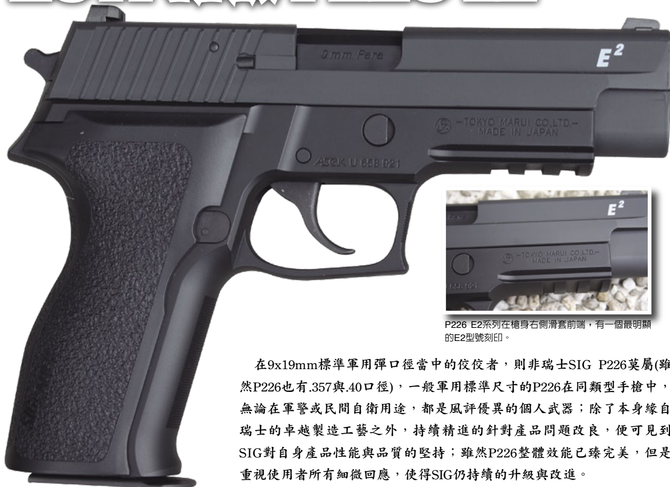
P226 E2系列在槍身右側滑套前端，有一個最明顯的E2型號刻印。

在9x19mm標準軍用彈口徑當中的佼佼者，則非瑞士SIG P226莫屬(雖然P226也有.357與.40口徑)，一般軍用標準尺寸的P226在同類型手槍中，無論在軍警或民間自衛用途，都是風評優異的個人武器；除了本身緣自瑞士的卓越製造工藝之外，持續精進的針對產品問題改良，便可見到SIG對自身產品性能與品質的堅持；雖然P226整體效能已臻完美，但是重視使用者所有細微回應，使得SIG仍持續的升級與改進。