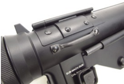
ICS M3衝鋒槍全槍以金屬複合材料打造槍身整體，可使槍體保養更為便捷。