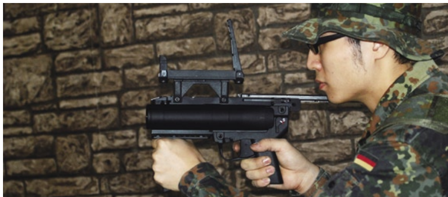
這支由Iron Airsoft出品M320A1 GLM，製造功力相當討好，金屬主體呈黑鐵色，跟實物相當接近。

M320A1 GLM(Grenade Launcher Module)榴彈發射器，是由Iron Airsoft出品，製造功力相當討好；金屬主體呈黑鐵色，跟實物相當接近，刻印除了H&K的品牌Logo外(限於H&K玩具品牌被Umarex購得)，其他型號、製造地、警告和廠房認證壓印(Proof Stamp/Mark)都精細呈現；以Stand Alone模式拿上手，感覺實在，沒有搖晃的情況，整體紮實，重量平均！護弓前附設的M1913 20mm戰術軌道上，加裝了一個MP7款式的摺疊手把，兩者操作相同；這個手把以兩顆Allen Key螺絲鎖著，拆除後，玩家能夠在M1913 MILSTD軌道自行安裝各式OTS(Off-The-Shelf)裝備。