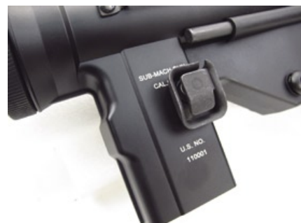
槍機蓋板與背帶環以?接加工製成，槍身左側彈匣釋放鈕鍍金沖壓型成，上下有仿真型號刻印。