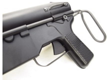
M3原本設計為用壞即丟不需要維修的武器，由於外型像是替汽車打潤滑油的油槍，所以俗稱“M3黃油槍”。

M3與M3A1最主要的不同點，是將常故障右側拉槍機的拉柄組件，改為直接在槍機的前端有一個凹槽，使用者翻開加長的退殼蓋，直接用手指勾住即可拉槍機；M3原本設計為用壞即丟不需要維修的武器，由於外型像是替汽車打潤滑油(黃油)的潤滑油槍，所以俗稱“M3