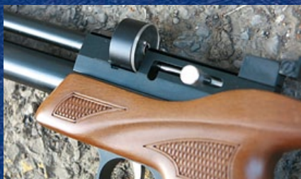
使用轉輪彈倉以上彈桿裝彈時狀態。

CP1-M 的照門設計的較高，照門上黑色的凹槽和準星形成完美的三角瞄準點，可以讓射手更容易捕捉目標，還可以透過照門上螺絲調整歸零，在槍身的上方還裝有一道 11mm 的短導軌，以便安裝瞄準鏡；CP1-M 的槍身完全由鋁