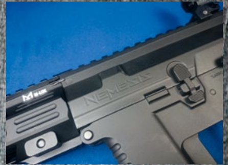
槍身刻有“復仇女神”(Nemesis)字樣。