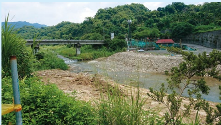
戶外溪流環繞，造就出極佳野戰環境。