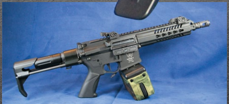
小編自行加裝自購電動彈鼓，PDW變身為輕機槍。