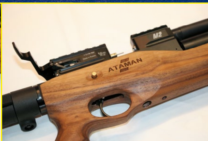
M2R 採用加長型上膛桿，操作更為省力。