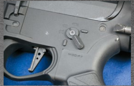
45 度角火控選擇鍵，切換更加快速。