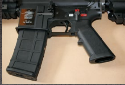
VR416 全系列均配備毒蛇自製氣動彈匣。