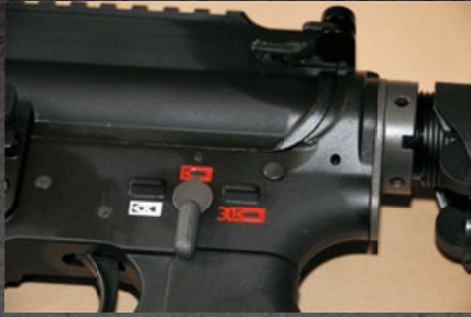
火控選擇鍵採用萬國通用圖示。