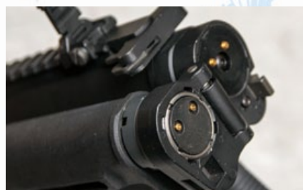
摺疊式伸縮托利用兩個接電點與波箱連結。