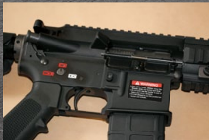
槍身與 M4A1 有細部不同，為全新數據 CNC 加工。