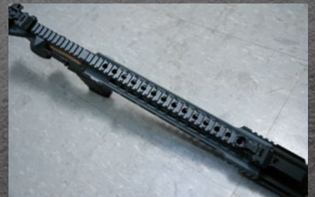
機匣頂端的全通式戰術軌道。