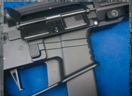
位於槍身右側的彈匣釋放鈕，槍機片上的美國國旗代表實銃的生產地。