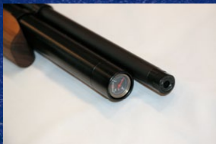
氣瓶前的空氣壓力計表。