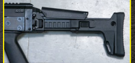
伸縮托有六段長度可調整，腮貼亦可調高 1.5cm。