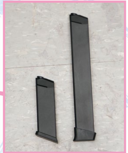
Ares M45採用AR構型，外觀緊緻精細，附有125發和55發的長、短彈匣各一。

要 說最早生產的AR衝鋒槍，當然是柯特(Colt)自家編號M635的“柯特9毫米衝鋒槍”(Colt 9mm Submachine Gun)，其設計目的是要搶佔80年代初期的美國衝鋒槍市場，雖然採用9mm或其他口徑彈藥的衝鋒槍在二戰前已被廣泛使用，但也一直有準確度欠佳的缺點，直到H&K推出MP5後才改變了這觀點，再加上在1980年的伊朗大使館事件中，英國SAS部隊在全球媒體眾目睽睽下，手持MP5完美地解決了事件，為MP5衝鋒槍免費做了一個影響力十足的廣告，自此之後，各國便開始大量採購新型衝鋒槍，以取代現役的舊式衝鋒槍，而柯特便以AR-15步槍為基礎，開發出採用9x19mm子彈的M635衝鋒槍，希望能跟H&K MP5一爭長短，但由於MP5有SAS的加持，所以在這場競爭中M635可說以慘敗收場，最後便在市場中消聲匿跡。