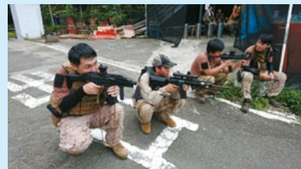
生存遊戲玩家利用空檔進行試射。

其命名為“惡魔島”(Alcatraz)生存遊戲射擊場；春田商社利用天然地形和人為設施，並參考了國際實用射擊(IPSC)和近距離戰鬥(CQB)的概念，設立了十餘個難易度不同的關卡，讓玩家能藉由個人的精準射擊技巧和戰術運動能力，來達成過關或對戰的勝利；各位住在台中地區的戰友們，有空時不妨到惡魔島小試身手一番，包準讓你大呼過癮！