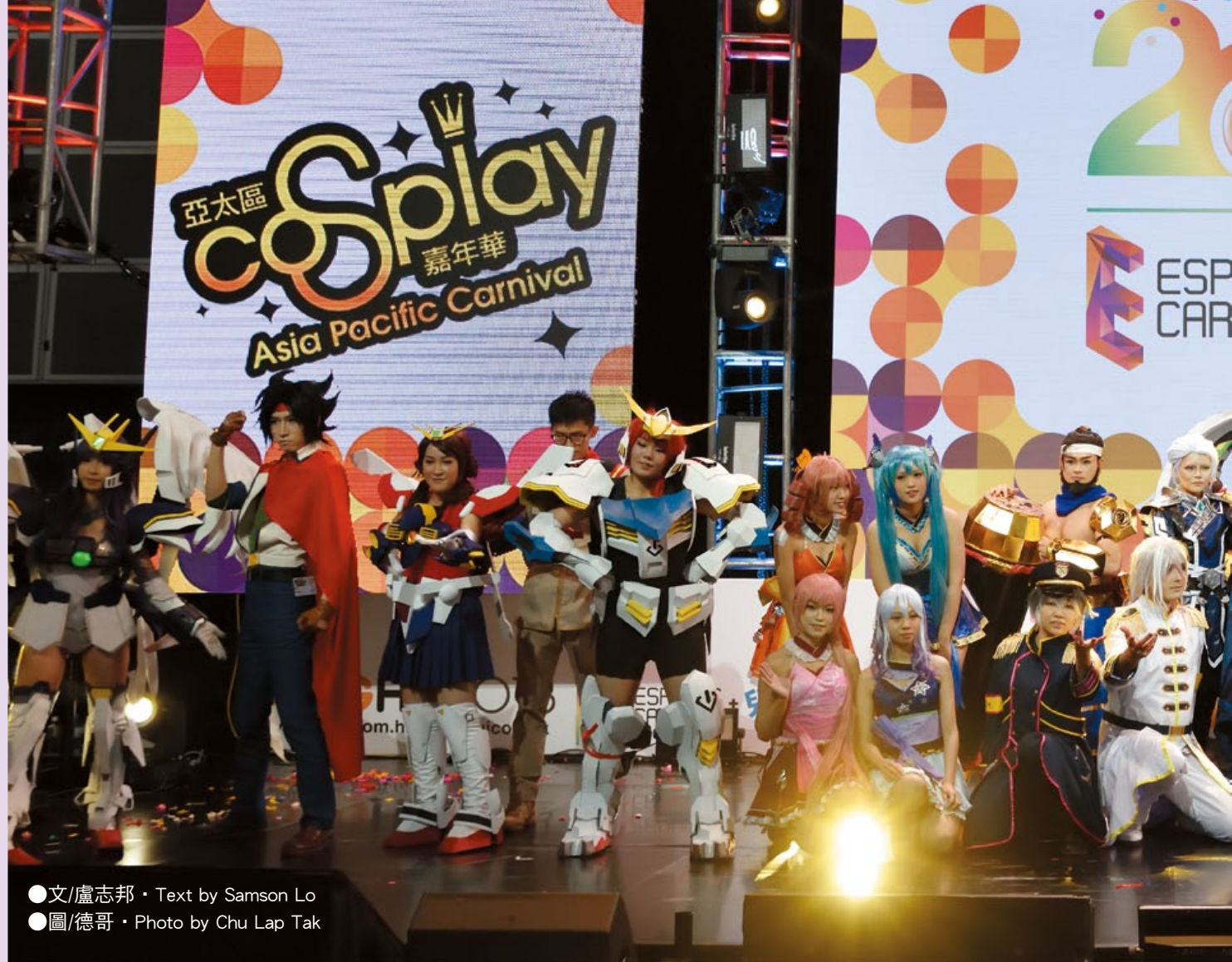
●文/盧志邦 · Text by Samson Lo