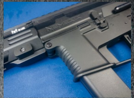
彈匣插槽座前有波浪狀的手握凹痕。