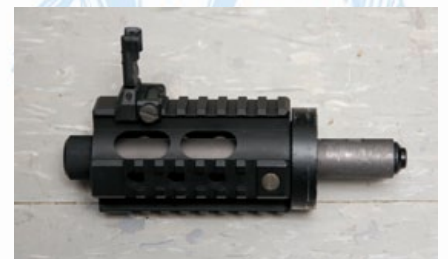
M45的短型前段，結合準星、防火帽、槍管及護木。