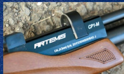
槍身右側標示使用 4.5mm (.177cal) 口徑。