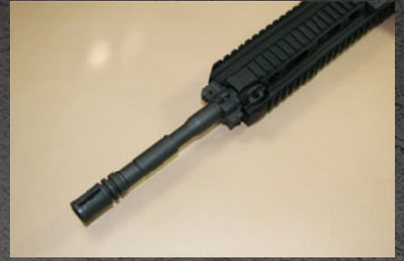
VR416 外觀類似配置 M4A1 前段槍管的 HK416 早期款。