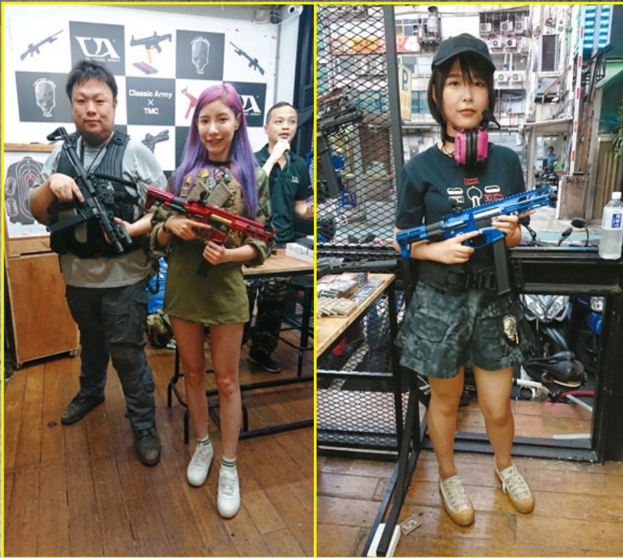
CA台灣新代理八角銃工(Octagon Airsoft Taiwan)於TMC台北店發表X9衝鋒槍，有五款顏色可供選購。