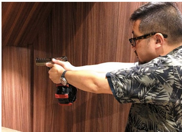
筆者持續狂操猛射 AW 彈鼓，效果較預期來得更好。

軍 械士工坊 (Armor Works) 與偉益 (WE) 最近合作推出 GBB 手槍專用彈鼓，本體以強化塑膠打造，內建空間加大的金屬氣化槽，儲氣量較之前的彈匣要增加了約一倍左右，裝彈數更由一般標準的 20~30 發增至 350 發，容量堪稱是目前市售手槍用 GBB 彈鼓之冠，對於想把手槍當作次要武器的玩家而言，更是如虎添翼，尤其是可自動射擊的 G18C、G19C、M9A1 等手槍，若再加上時下流行的手槍變身衝鋒槍套件 (如 CAA Roni 及 RST Orion)，真可說已經把手槍進化到衝鋒槍的等級啦！