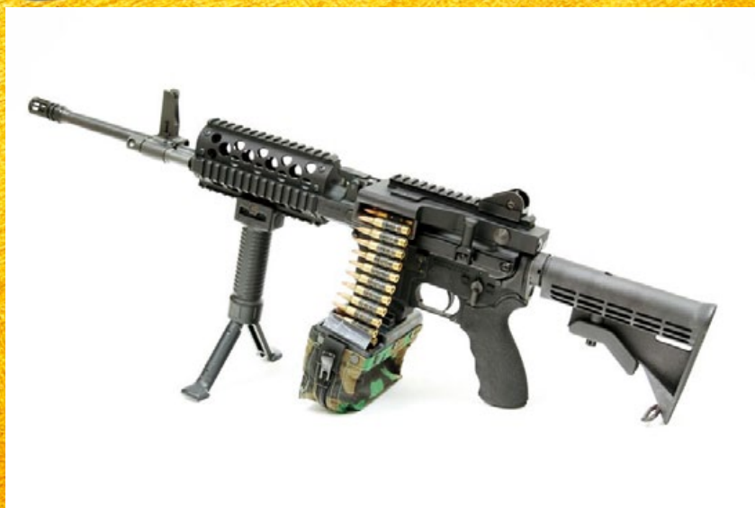
伯勞鳥(Shrike)實銃被視為步槍變身輕機槍的成功案例。

美 國戰神防衛 (Ares Defense) 公司研發的伯勞鳥 (Shrike) 輕機槍實銃，可提供一挺完整成槍，或以上槍身升級套件 (Upper Receiver Module) 改裝 M16/AR-15 步槍系列；該輕機槍是採用瓦斯操作活塞傳動系統操作，可快速更換不同長度的槍管和一組擁有 MIL-STD-1913 戰術導軌的護木，