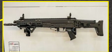
斯洛伐尼亞 Arex 公司在美國 SHOT Show 中發表的 Rex AKB15 實銃。