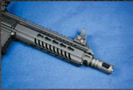
鋁合金加工的匙孔護木外觀平順，手感不錯。