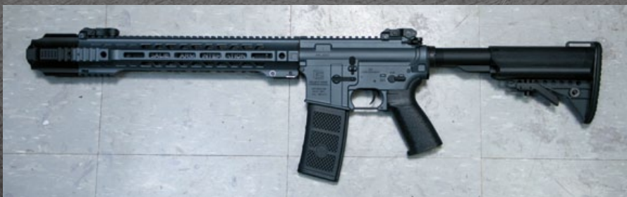
標準版 EMG/SAI GRY15 Gen2 步槍，RIW 表面處理已被 SAI 官方認可，可算是首支 Ceraoqe 塗裝的量产化商品。