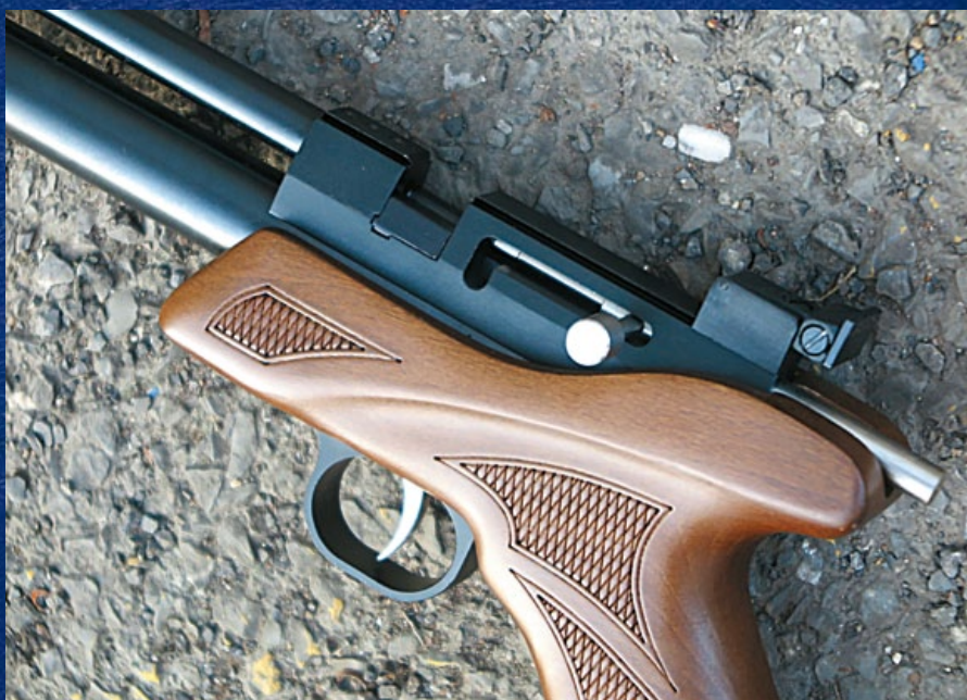
使用單發手動裝填時，需要在彈槽放置一個上彈置具。