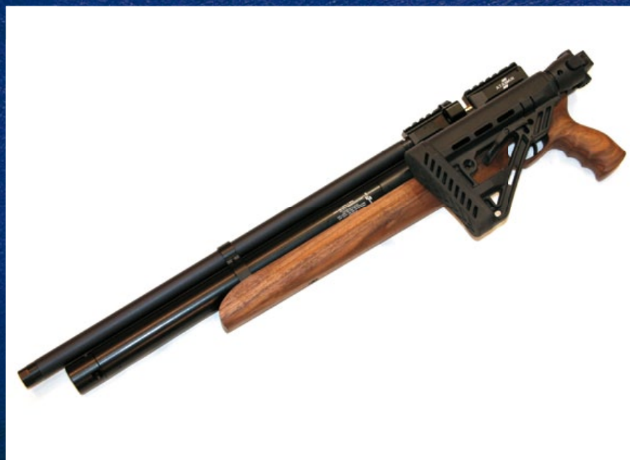
M2R 是一把採用軍規摺疊托的氣動卡賓槍。

阿塔曼 (Ataman) M2R 緊緻型卡賓氣槍 (M2R Compact Carbine) 除使用堅固的核桃木槍身外，還設計了一組軍用造型的伸縮托，不但讓原本的槍身長度大幅縮減，更可以在摺疊後輕鬆收納至槍袋，長度也剛好可放進汽車後座，完全不會另外佔據行李廂的空間，騰出的空間就可以放置其他野外活動的器具，如腳踏車或露營用具等，而且摺疊操作過程方便，只需要按下卡榫，便可將槍托摺疊，這也是 M2R 跟前一代採用固定托版本的最大不同處，不但槍身變得更輕巧，而且攜帶方便，緊緻耐用；M2R 緊緻型氣動卡賓槍 (Compact Carbine) 可選擇五種口徑的子彈，分別是 4.5mm(.177) 口徑 (裝彈