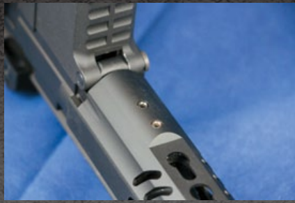
護木使用兩顆內六角螺絲為固定鎖點。