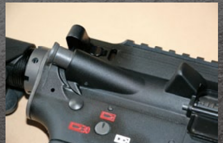
下槍身的線條較 M4A1 強化許多。