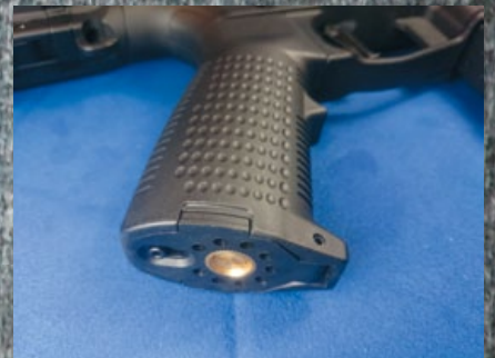
防滑握把內裝馬達，但並未變得較厚。