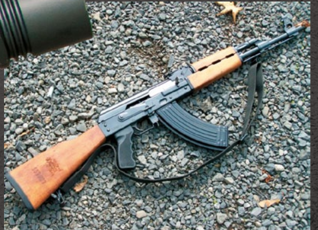
前南斯拉夫生產的 Zastava M70 步槍是 Rex AKB-15 實銃的藍本。