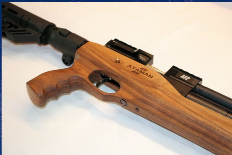
扳機扣壓可由護弓前的小孔進行調整。