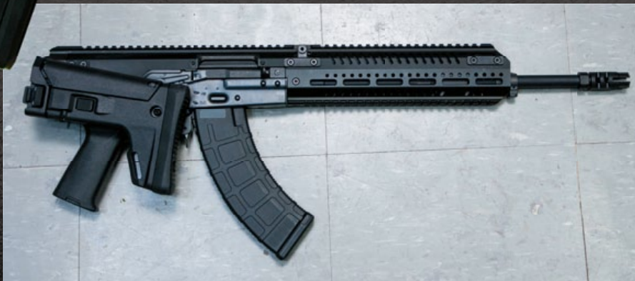
槍托帶有濃厚 ACR 風格，可向槍身右側摺疊。