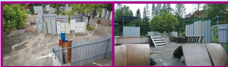
利用人為設施設立了十餘個難易度不同的關卡。

春田商社是台中知名的生存遊戲軍品裝備專賣店，在內行玩家中有相當好的口碑，近年又跟香港“鬥陣俱樂部”(Fighting Club Custom，簡稱FCC)合作開發新款遊戲用槍及戰術裝備，並且在台中著名的大坑風景區麗寶樂園旁邊，開設一處專供生存遊戲使用的野戰場地，由於該場地是利用河流環繞的地形設置，感覺很像位於舊金山海灣中惡名昭彰的惡魔島監獄，因此就將