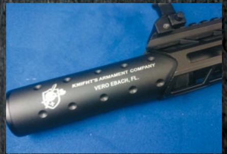
X9 SD可選配KAC款式減音器，但原本的攻擊頭防火帽仍附贈。

A R-9 是 1980 年代因應警務人員需求而開發的 9mm 衝鋒槍，該槍配置簡化的 AR 步槍氣體傳導系統，利用簡單的反衝原理來作用，雖然提高了射速，但後座力也無可避免地擴大其彈著面積，不過 AR-9 的效能就是提供近距離的火力壓制和突擊效能，而且在狹窄的建物內槍管太長也不夠靈活，於是 AR-9 也捨棄了長槍管，等於也就不在乎長距離準度，因此可說 AR-9 原本只是在新世代衝鋒槍問世前的過渡型產品，但是卻意外受到射手的認可，主要是因為該槍採用 AR 步槍的火控系統，射手不需重新適應，而且 AR-9 使用跟 9mm 手槍相同口徑彈藥，可大幅減少攜帶重量，反而成為自樹一格的槍型，因而不少槍廠也陸續推出類似槍款或升級套件，讓 AR-9 槍族日益壯大。