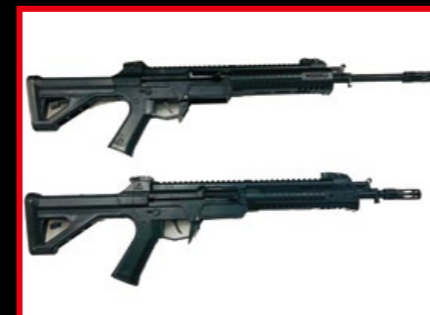
191 訓練步槍分為長管型突擊步槍和短管型卡賓槍兩款。