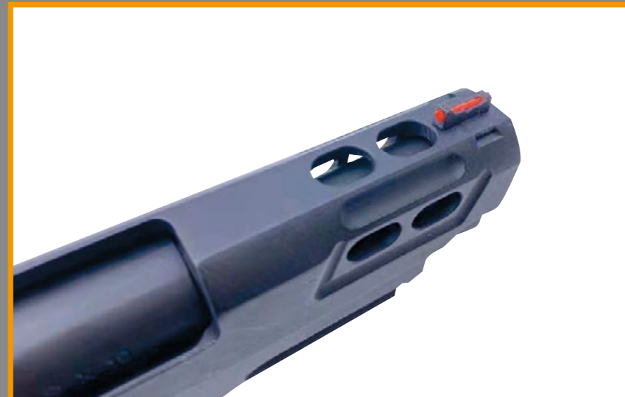
滑套上開了六個鏤空孔洞，是 R613 外觀上最吸引人之處。