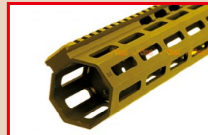
護木左、右側面裝有 NSR-8.5 M-LOK 導軌系統。