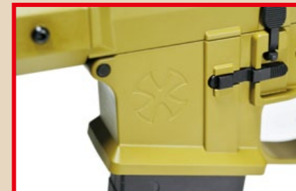
彈匣插口左側刻有合法授權的 Noveske 商標。