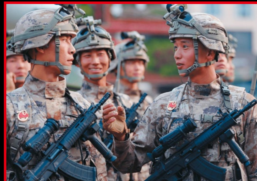
出現在 2019 年閱兵式中的解放軍空降兵與 QBZ-191 卡賓槍實銃。