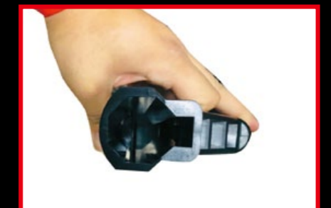
拆下托底墊，即可見四段調整強度的托桿。