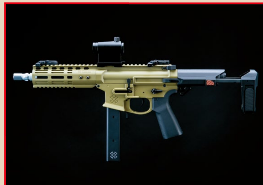
外型緊緻的 Space Invader 配備造型洗鍊的 EMG/Noveske 伸縮托。