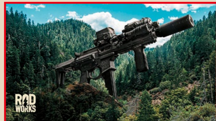
Noveske 原廠海報將 Space Invader 設計成一艘從天而降的巨大太空船，噱頭十足。(Image courtesy of ROD Works).