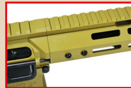
機匣頂端裝有 20mm 直通式軌道。