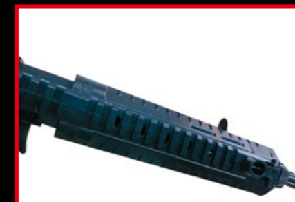
護木上端裝有直通式軌道和折疊式準星。