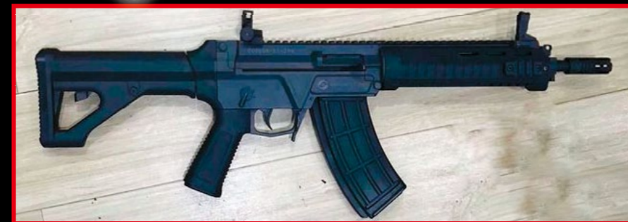
類似美軍 Mk18 CQB 步槍的 QBZ-191 卡賓槍實銃，配備適合近戰的 10.5 吋槍管。(By Internet)