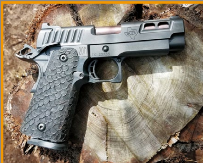
實銃 2011 DVC Carry 是 STI 熱賣的緊緻型手槍。