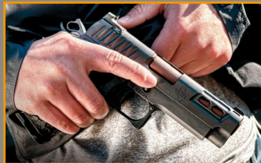
實銃 DVC Carry 短小精悍、易於攜帶，深受執法探員信賴。(By The Firearm Blog)

Army R613 的握把較一般 1911 稍短但更厚實，這是因為該槍採用跟實銃 2011 DVC 一樣的雙排上彈方式，但平