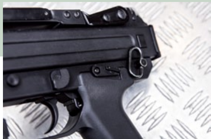
位於握把頂端的射擊模式選擇鍵可雙邊連動，後方則是槍背帶扣環。