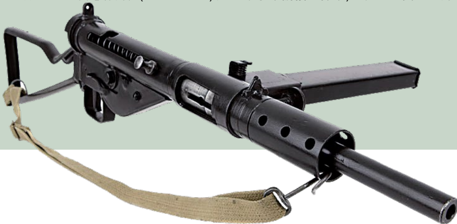
上槍左側仍保有實銃的AK系列特有鏡軌。

鋒槍，於是斯登(Sten)衝鋒槍便因應誕生，雖然此槍的造價低廉，也沒有彈藥短缺的問題，卻因為製造品質低劣而出現嚴重的卡彈問題，連命中率也很差，而且保險裝置常鬆脫而出現走火情形，造成前線英軍士兵對斯登衝鋒槍的評價不佳，甚至替它取了個“水管槍”的渾名，如果能夠自行選擇，他們寧可使用擄獲的德軍MP40衝鋒槍，不過斯登衝鋒槍在經歷過一至六型(Mk I~Mk VI)的持續改良，性能和可靠度均大幅提升，不但全球共有50個國家曾使用過斯登衝鋒槍系列，挪威、波蘭和澳大利亞亦紛