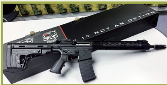
幽靈終極步槍(PER)是APS經過兩年努力才推出的實戰風格新槍。