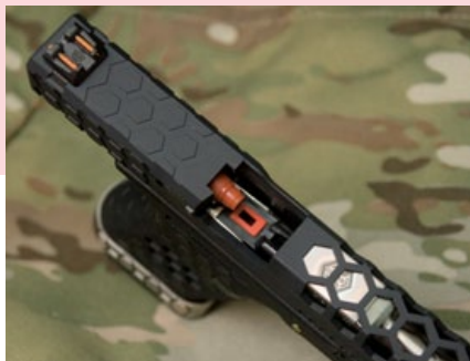
所有的VX系列手槍均配置火紅色氣嘴。

握把的緊緻度, 如此一來不但適用於生存遊戲, 更適合作為射擊競賽的專用槍械; VX系列手槍搭配了AW標誌性的火紅色氣嘴, 替該槍提供了穩定的火力和爽快的後座力, 原廠的外管採用霧銀色電鍍並設有內螺紋(以供加裝滅音器), 加上同樣霧銀色的彈匣搭配上鏤空蜂巢狀的滑套及下槍身, 讓VX系列手槍得造