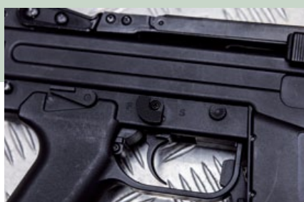
位於槍身右側扳機護圈上方的保險鍵，是單獨的設計。