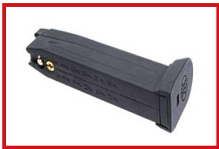
彈匣的瓦斯注入口移至側邊上方，不會破壞仿真外觀。