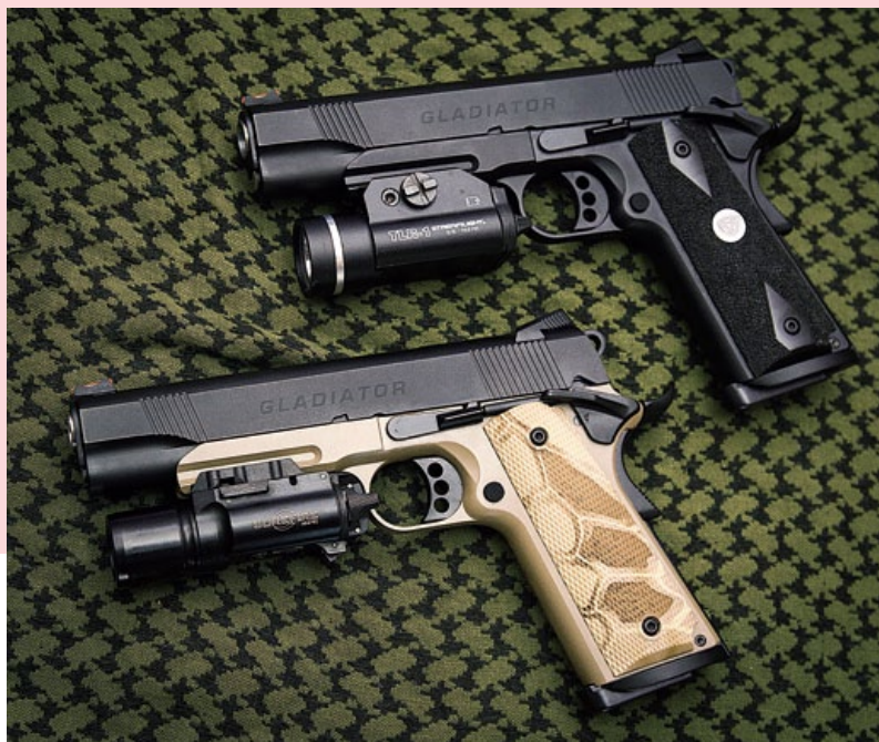
格鬥士 M1911有黑色和銀沙 TWO TONE 2種槍款。