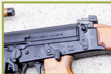
機匣上刻有實銃型號，射擊模式選擇鍵因被槍機阻礙，不能撥到自動射擊位置。