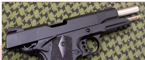
格鬥士 M1911有黑色和銀沙 TWO TONE 2種槍款。