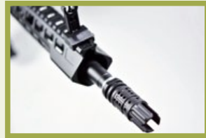
裝有洩焰孔的三叉式Icefyrre防火帽，一看就知道是高等貨。