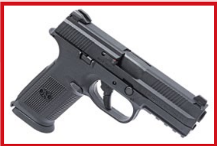
FNS-9人體工學設計輕量化、左右雙邊連動操作介面是目前槍械設計潮流。

Cybergun近期推出的最新產品，就是以現代化人體工學設計的雙邊操作介面，搭配新世代輕量潮流的塑料下身，