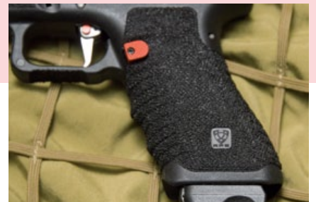
現在很流行燒炎型握把，上面還有APS的商標。