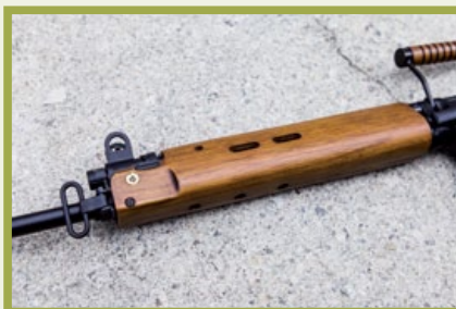
木製護木用料紮實，堅固且像真，絕對耐操。