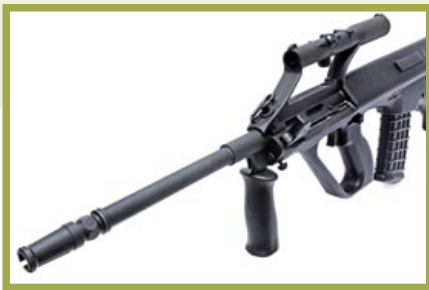
GHK AUG A2配備跟實銃一樣的20吋槍管。