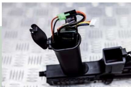
鎳氫電池或鋰聚合物電池可裝在前握把內，電線不會外露。