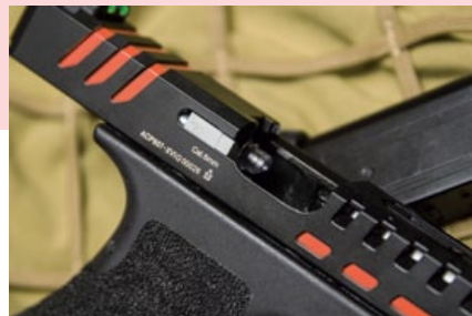
天蠍手槍的滑套拋殼鉤特寫。

重射手的安全，所以在零系微動扳機組加上了手指扣上才能操作的保險裝置；雖然許多人認為競技手槍一定要客製化，而且許多部件也得過細部調校，但射手的手感才是最重要的，就好比生存遊戲，並不是每個人拿把機槍下場，就可以憑火力撐過全場，當然競賽手槍要求精準度高，要能快速更換彈匣和上