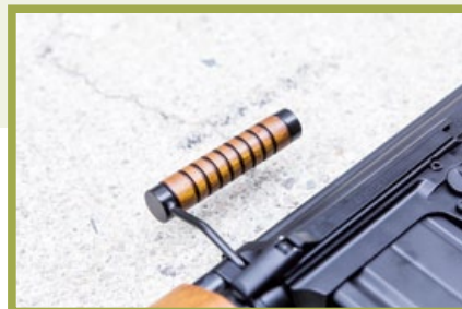
木製提把完全依照初期型實銃而複製製成。