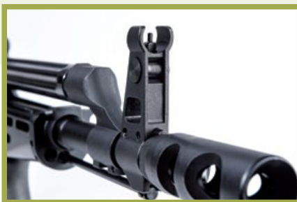
跟實銃神似的鋼製防火帽和可調式準星。