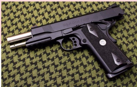
綽號“黑魂”的Marcux採用黑色表面處理，搭配精美的銀色槍管。

APS則是經過兩年時間的研發，建基於傳統氣動M1911手槍的設計，用心研發了格鬥士(Gladiator) M1911系列，並分別用古羅馬知名格鬥士馬庫斯(Marcux)及克雷斯(Crxius)來命名其兩支M1911新作。馬庫斯(Marcux)不但是威猛的格鬥士，也是電玩《戰爭機器2》(Gears of War 2)中的靈魂人物，APS除了採用此名外，還根據外觀特