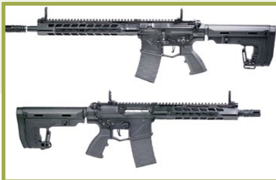
APS幽靈步槍分為配備10吋護木的MK I(下)和12.5吋護木的MKII(上)兩款。