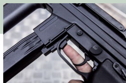
位於扳機護圈最前方的彈匣釋放鍵。