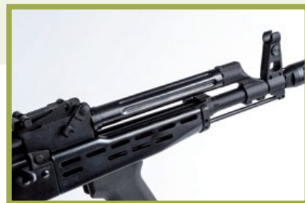
沖壓製成的鋼質瓦斯活塞管和下槍身。