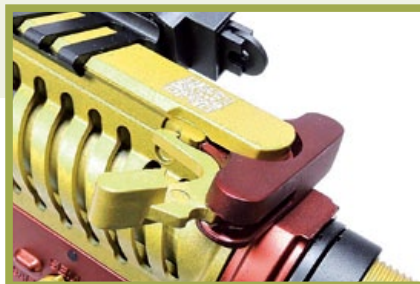
加裝輔助鈎的競技型槍機拉柄(MSCH)。

跟一般M4的濃厚戰術氣息比起來，槍身塗裝由鮮豔的紅、金、黑三色所構成的ASR120紅龍(Red Dragon)和ASR121金龍(Gold Dragon)，明顯的偏向時髦潮槍設計，並兼具濃厚的客製化競技風格！APS原廠將防火帽、彈匣