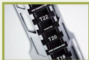
在Phantom Striker戰術護木上方裝有一條有刻度的長條戰術導軌。