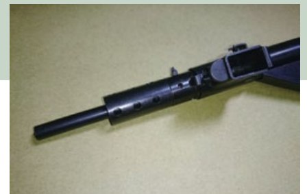
GHK Sten Mk II操作模型槍的槍管套筒上有12個散熱孔。