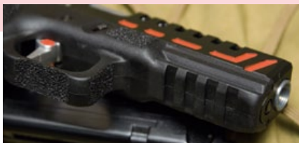
為配合競技需求，滑套卡榫也經過特別設計。

APS天蠍(Scorpion)手槍使用鑄鋁合金以CNC加工製作的滑套，幾乎是客製化競技手槍的基本要求，然而這把手槍配置了APS獨創的“零”系微動扳機組，扳機組的高敏感度能讓射手在扣扳機時，可以毫不費力地擊發，減少手指的出力而影響槍枝的瞄準，雖然扳機的扣壓如此敏感，但APS相當注