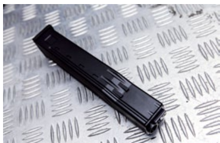
仿實銃四排式裝彈設計的厚實彈匣，彈容量為40發。