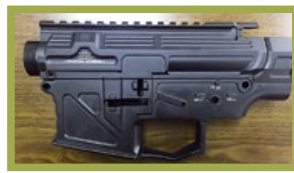
鋁合金槍身經過人因工程改造，重量大幅減輕。