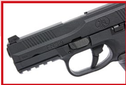
滑套左側表面有FN原廠授權的廠徽及槍枝型號刻印。