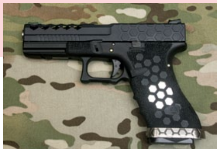
黑色滑套搭配霧銀色外管和聚合物下槍身的VX0101手槍。

源 自台灣的軍械士工坊(Armorer Works, 簡稱AW)所推出的新作VX系列手槍, 採用蜂巢式圖騰作為其構型特色, 亦即利用CNC削切加工製作滑套上方及下槍身表面的鏤空蜂巢狀雕飾, 除了外觀上相當酷炫之外, 同時亦減輕了整體槍重, 而且這些看似裝飾的加工, 除可當成防滑紋外, 亦可增加