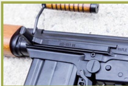
摺疊式槍機拉柄(上膛桿)是 L1A1與FN FAL的主要區別之一。