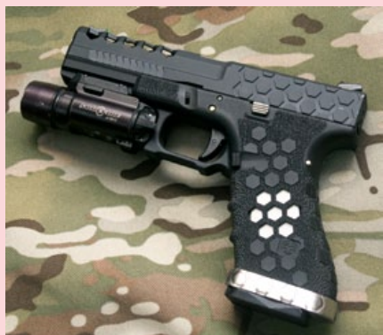
加裝槍燈的VX0101, 其戰術化設計可滿足玩生存遊戲的需求。