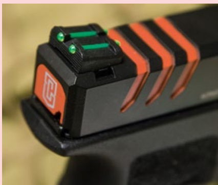
天蠍手槍的準星和照門都加裝了光纖棒，瞄準更精確。