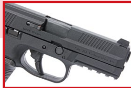
滑套左側表面有美國製造及FNH USA的刻印。