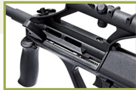
裝在槍身左側的弧形可動式槍機拉柄，跟AUG A1的方形略有不同，且上膛後拉柄可折起。