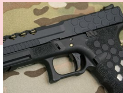
滑套後方的蜂巢狀浮雕具備防滑功能。