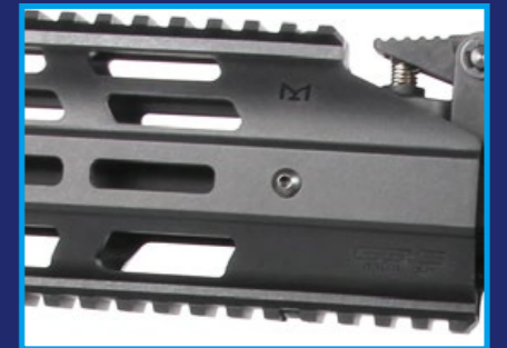
M-LOK 護木的拓展性極高，可安裝大量配件。