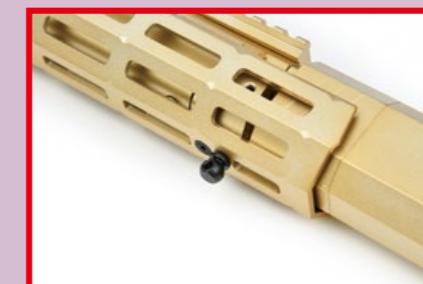
M-LOK 護木下方裝有槍背帶扣。