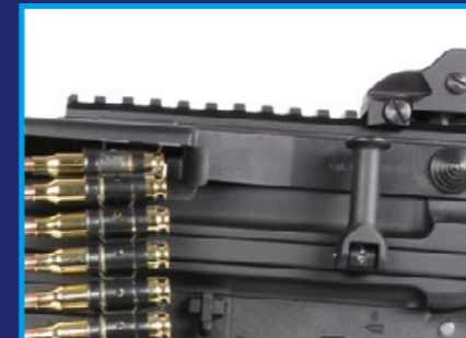
上槍身設計很有型，為該槍增色不少。