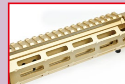
鋁合金打造的 M-LOK 戰術魚骨護木。