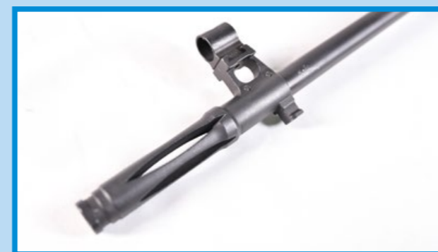
獨有的防火帽與準星座為一體成型。

由於 SVD 實銃誕生的時間早在 60 年代初期，當時的金屬加工技術仍以車床切削為主，所以 SVD 的槍體便是將整塊鋼材挖空、切削而成，並不像現在