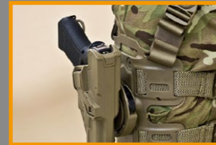
G17 手槍的可靠性深獲軍警 / 執法單位的愛用。