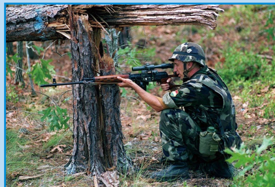
匈牙利因曾屬華約集團，因此也擁有大批 SVD 狙擊槍。