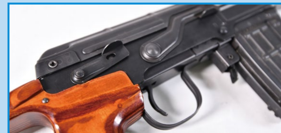
位於槍身右側的火控撥片。

LCT SVD 除了全鋼車削製作難度頗高外，還有另外一個也屬高難度的工法，即是鋼製一體成形外管，由於其長