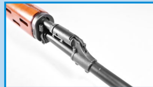
SVD 實銃上的瓦斯鋼管也忠實複製。