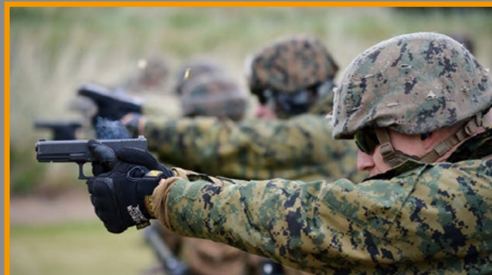
美軍陸戰隊以 G17 手槍作為配槍選擇之一。