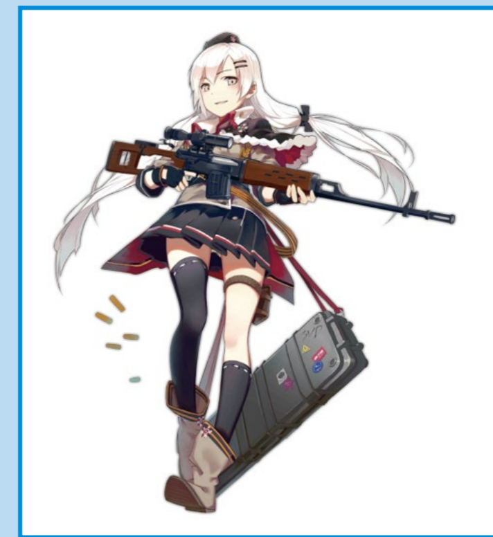
動漫《少女前線》亦有持用 SVD 的角色。(By Girls' Frontline)

沖壓和焊接的簡約工法，所以利成科技 (LCT) 在複製這把 SVD 時，也做了相當多的考證，加上該槍也授權其他共產國家生產，在細節部分或有不同，但是最經典的 SVD 的還是以俄製為主，LCT 便以此槍為基礎，複製了這支長達 1.25m 的電動狙擊槍。