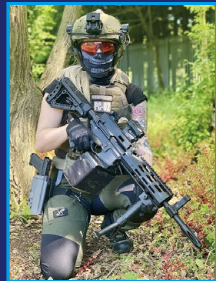
G&G CM16 LMG 重新定義了跨界生存遊戲輕機槍。(By FFA)