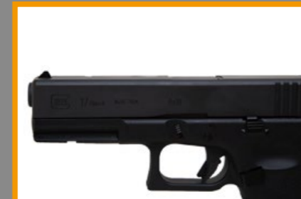
不論外觀與操作性皆能跟實銃比擬。