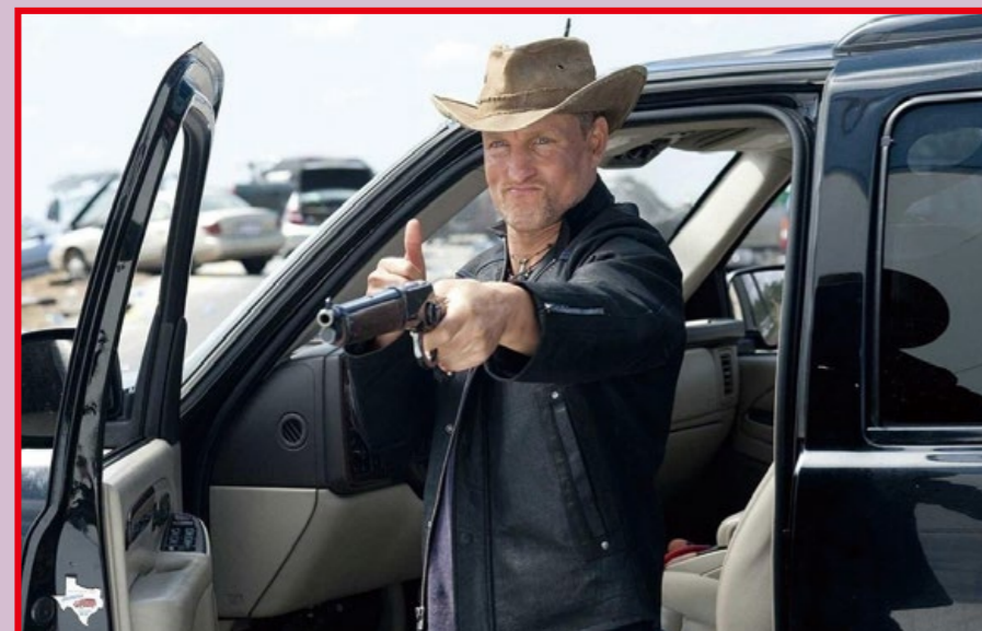
知名演員伍迪·哈里遜 (Woody Harrison) 在電影《失樂園》(Zombieland) 片中手持 M1873 馬槍的英姿。