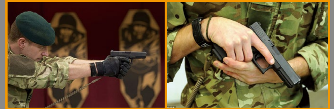
G17 也獲的英國皇家海軍陸戰隊採用。

基本上，在歐美販售的 Cybergun/KWC Glock G17 Gen4 氣動手槍，都被視為跟實銃同等級的訓練器材 (註：因該槍使用 4.5mm 口徑的鋼質 BB 彈