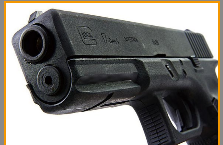
滑套前端有 Glock 原廠授權的商標和型號。