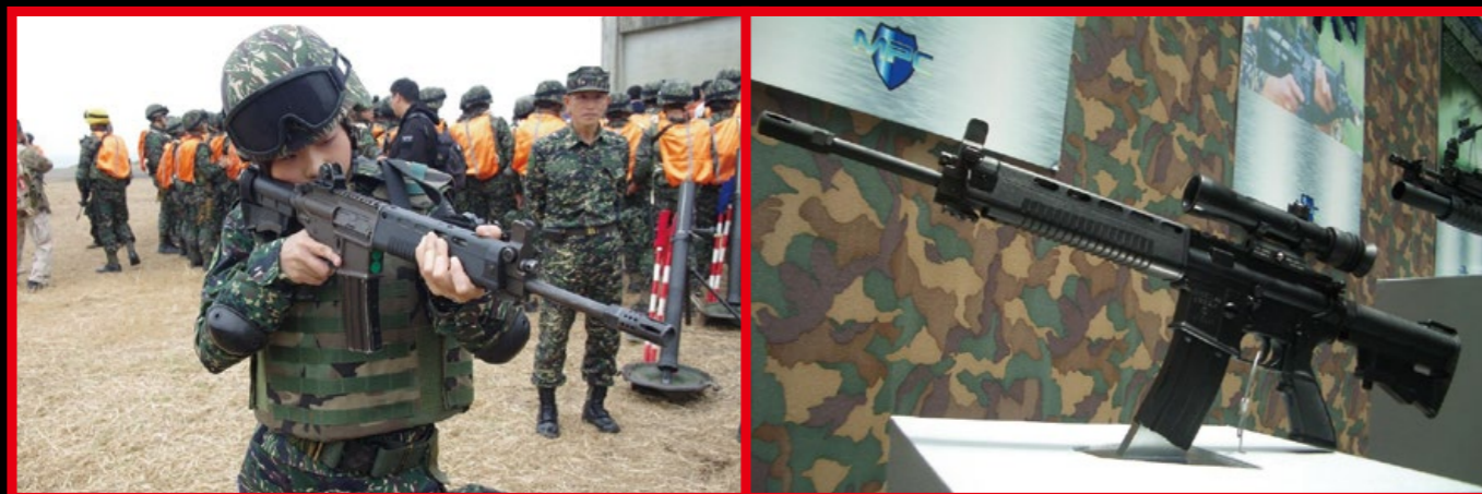
T 91 是台灣自製的新一代戰鬥步槍。(By UDN)