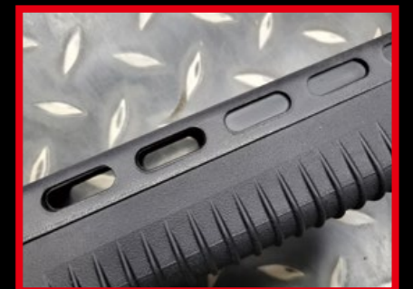
搭配強化尼龍纖維材質的護木。