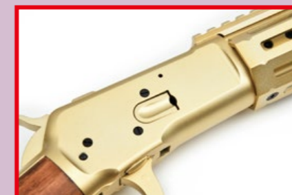
位於槍身右側的 BB 彈裝填口。