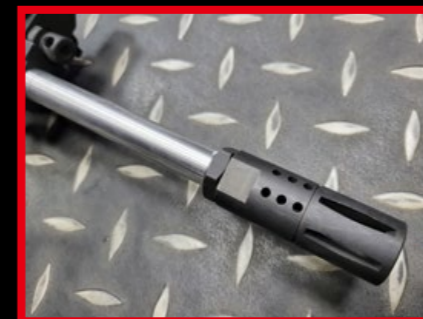
實銃等級打造的防火帽。