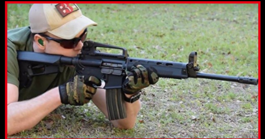
外銷美國的改裝版 T91 被稱為 Wolf A1，銷售狀況極佳。

模動工坊 (MWC) 之前已推出多款適用 TM 的 MWS 系統套件，由於採限量發行，深獲玩家的喜愛，不論是收藏保值或射擊把玩，都能讓玩家感受到物超