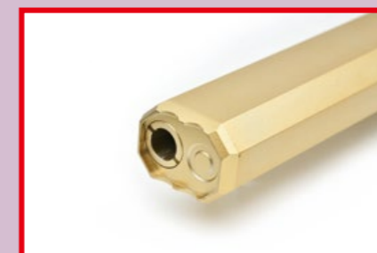
凹凸有致的八角形槍口，造型類似突擊步槍。

A&K 近年來的產品不但多樣性，而且大多是傾向於操作化樂趣的產品，遠離只能扣扳機的 BB 彈發射器之固有印