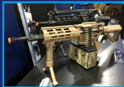
在德國 IWA 展出的怪怪 CM16 LMG。

百舌鳥 5.56(Shrike 5.56) 是一款由美國戰神防務系統公司 (Ares Defense, 簡稱 AD) 研發的匣、鏈雙用氣冷式輕機槍，發射 5.56×45mm 北約口徑步槍子彈，雖然之前阿瑪萊特 (Armalite) 曾推出過史東納 (Stoner) 機槍，但是過於繁雜的製程與成本，讓許多買家望之卻步，而 AD 的做法則是由原廠提供的一挺完整武器，或將現有的