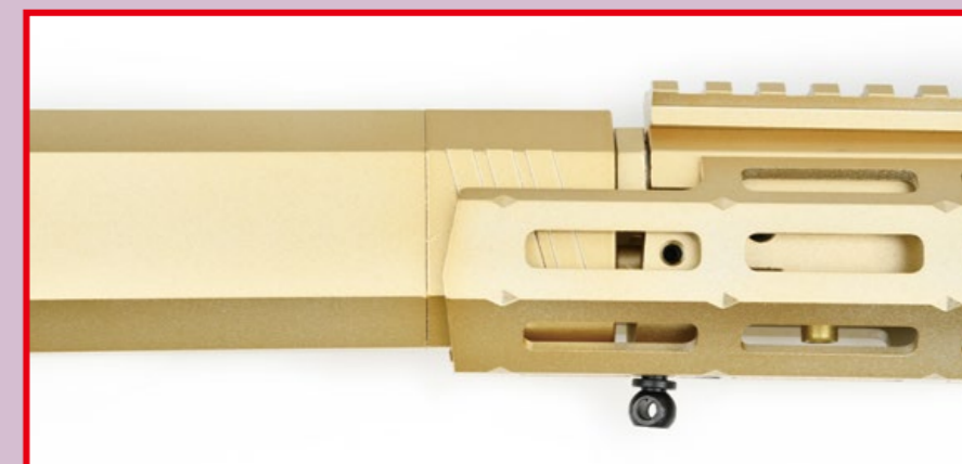
M-LOK 護木與槍身接合處牢固穩固，下場時不會晃動。