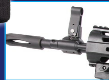
槍口配置 M60 機槍式樣的防火帽，凸顯其機槍血統。