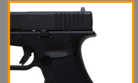
G17 Gen4 的海狸尾握把和可替換的握把片。