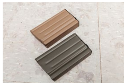
M110/M110K1配備的160發無聲彈匣。