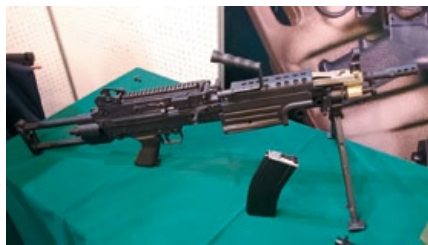
A&K在22屆武哈祭展出的M249 Para GBB樣槍。

以該廠於2012年推出的電槍版本再加以升級完成，畢竟電槍和氣槍的結構是完全不同，而且GBB系統的氣槍比起電槍還要承受更大的後坐力及操作上的震動，所以A&K除全面強化M249 Para的結構外，還將GBB系統以模組化總成的方式植入槍內，供氣方式則是將儲氣槽裝在M249 Para的彈藥箱內，如此便可省去外接氣管的累贅，如果氣瓶耗盡，