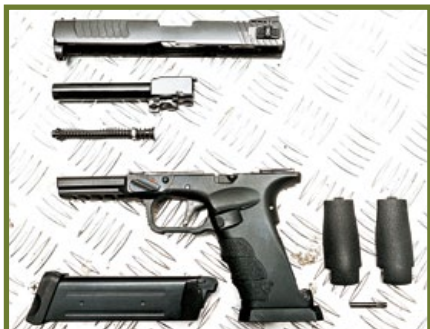
Shark手槍大部分解，只需拔出槍身上的插銷，便可快速拆除滑套。