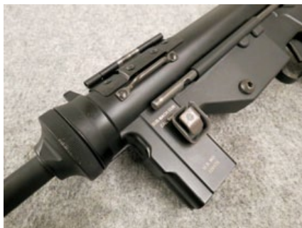
ICS M3A1的上槍身為鋁合金壓鑄，強度夠且耐用。