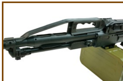
槍管上的金屬散熱被筒與上提把是PKP機槍最大特色。