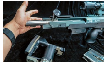
必需把槍托拆下才能把槍機取出。