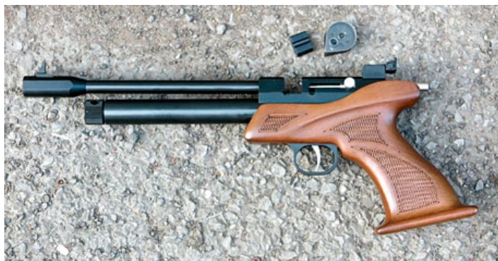
CP1-M可使用9發轉輪式彈倉，亦可單發裝填。