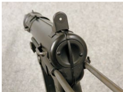
ICS M3A1配備的不可調式金屬照門。