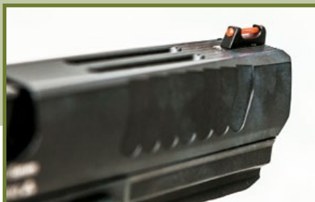
滑套上配置的光纖準星及缺口式照門。