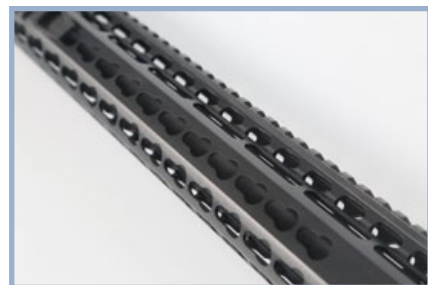
Keymod護木表面平整，沒有魚骨片也可徒手握持。