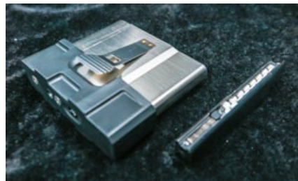
DSR-1和 Ares 其他的氣動步槍一樣，彈倉是和彈匣可以獨立分離。