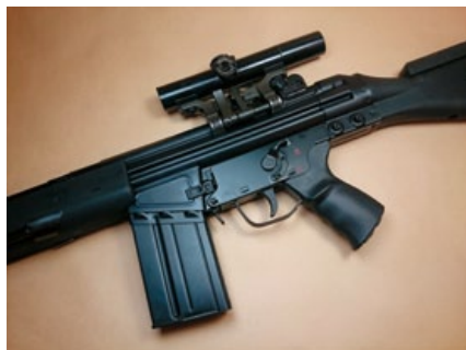
SG-1配置鋼製活塞搭配9mm培林，性能如虎添翼。