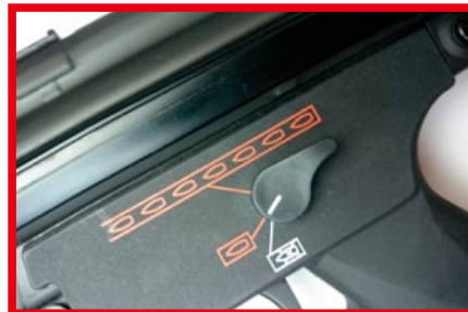
射擊模式分為單發、全自動射擊和保險三種。