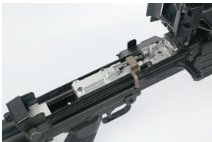
GBB式樣的機槍內部結構。