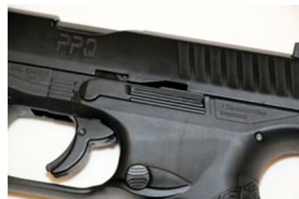
槍身右側設有美規的彈匣釋放鈕。