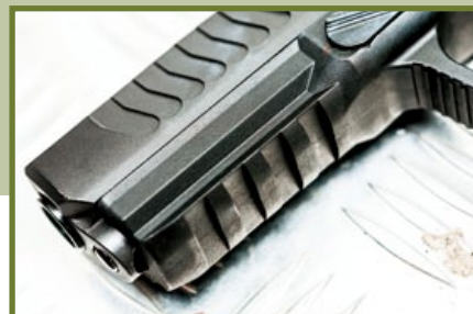
下槍身前方設有M1913軍規戰術導軌。