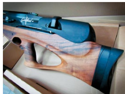
以人體工學設計的胡桃木槍托及手槍型握把。