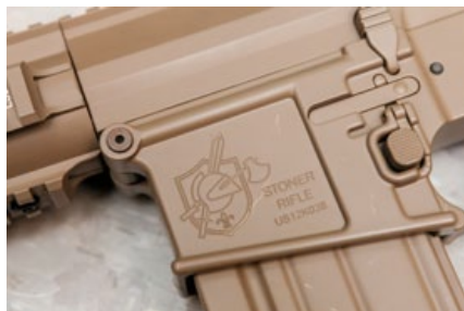
Ares M110K1的彈匣插口左側表面刻有KAC授權的商標。