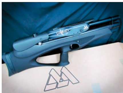
使用黑色強化塑膠托的Air Arms Galahad氣動步槍。

左或向右調整；在上膛部份，Galahad氣動步槍在槍身中心，使用航太級鋁材製作一支上膛桿，在每次射擊完畢後，只須用另一隻手輕輕一撥，便可完成下一發的裝填與射擊，而且只要使用一根內六角螺絲起子，就能更換左、右手射擊模式，這種類似早期來福槍的上膛設計，不但減少了整把槍的體積，而且不必大費周章的從槍中抽出槍機完成上膛，對於需要連續射擊目標時有很大的幫助，避免不斷變換姿勢加重射手的疲憊度。