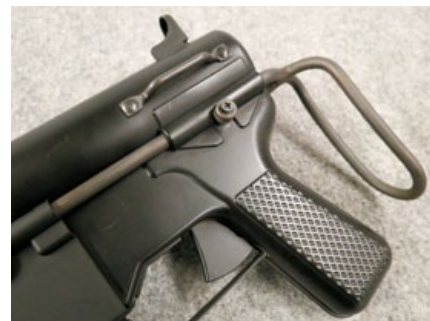
握把上的防滑紋路也忠於實銃的設計。