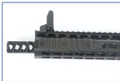
15吋的Keymod護木前端有3吋的戰術軌道，可供加裝槍燈或雷指器。