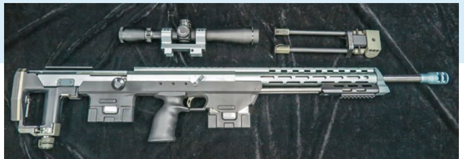
Ares DSR-1 除了折疊式腳架外，狙擊鏡則需另外購入。