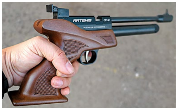
CP1-M可另購瞄準鏡，作為射擊輔助之用。