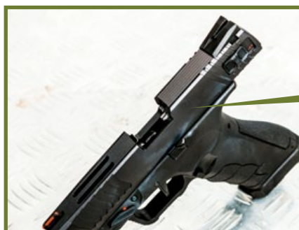
滑套頂端有兩個長方形開孔，以CNC加工鏤空，可減輕滑套重量。