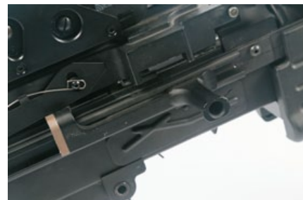
槍機拉柄(上膛桿)可做出跟實銃一樣的上膛動作。