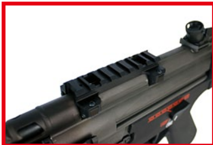
槍身上方的低軌鏡座，可自行搭配各式光學瞄具。