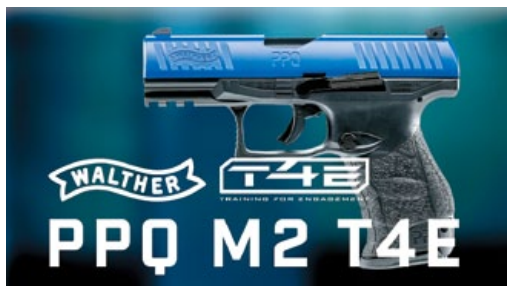
PPQ M2 T4E的外盒包裝簡潔。