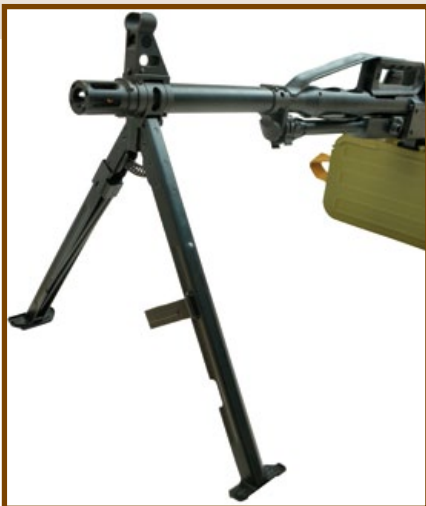
PKP電動機槍的鋼製腳架不論是重量或強度都跟實銃相差無幾。

早年因為資訊不發達，除了玩家或少數工作室自行改造的版本外，少有廠商開發俄系機槍的玩具槍版本，利成科技(LCT)從10年前的RP、RPK到近期的