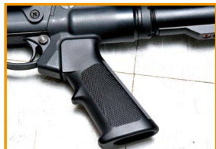
GE M870 CQB採用AR握把，射手易於上手。