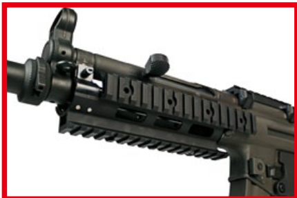
SWAT A4 Tactical搭配最新開發的RAS戰術魚骨。

A4 Tactical的短槍身及配置固定托，讓來自槍機復進的明顯後座力會更直接地回饋至肩膀，那種爽度著實不可言喻，小編在此先賣個關子，等你親自去體會就能明瞭，此外，Bolt SWAT系列還有一個獨特設計，就是利用槍機拉柄來當作選擇後座力震動的開關，當槍機拉柄後定在卡槽上時，ERB系統便會關閉後座力震動，變成一把普通的電動衝鋒槍，不過，誰會暴殄天物浪費這美妙的