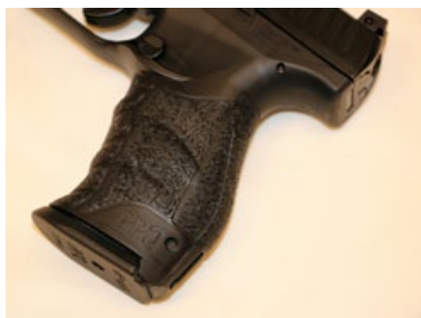
以工業用強化塑膠製作的適形握把。