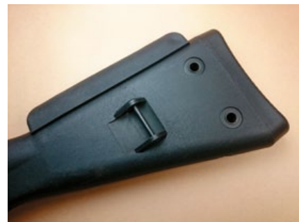
LCT SG-1強化塑料槍托的強度幾可媲美實銃。