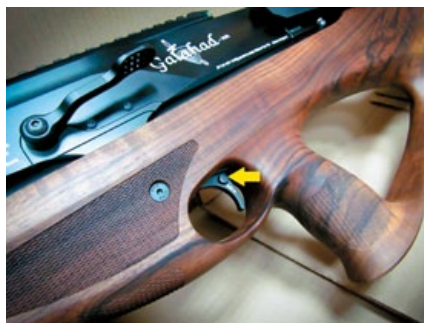
扳機上的保險裝置使用食指即可操作。