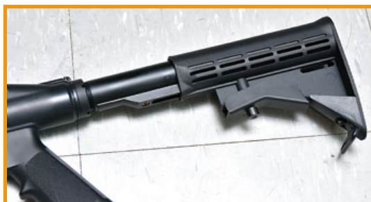
使用AR伸縮托的M870 CQB，操作便利。