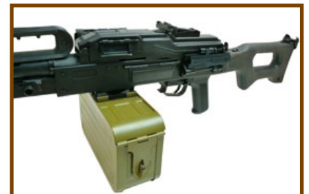
請注意槍身左側的光學鏡架完整重現!