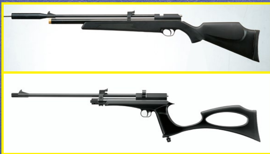
PR900S/W(上)是同廠CP-2(下)的升級改良版。