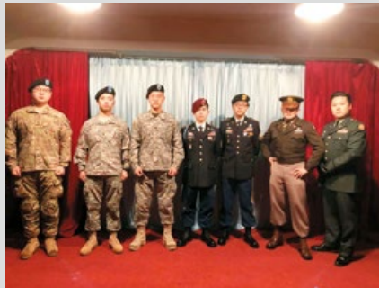
穿著美國陸軍制服的玩家一起登台亮相。