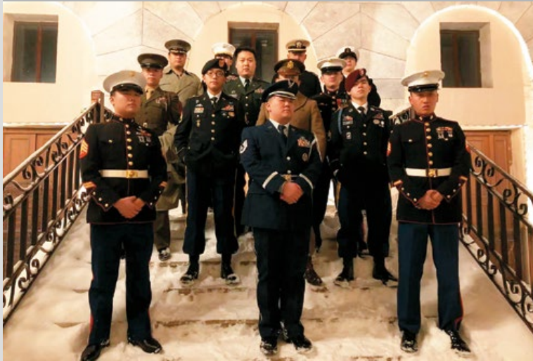
第一日活動部份軍迷們的合影，筆者因兼職工作人員而來不及拍大合照，誠屬遺憾。