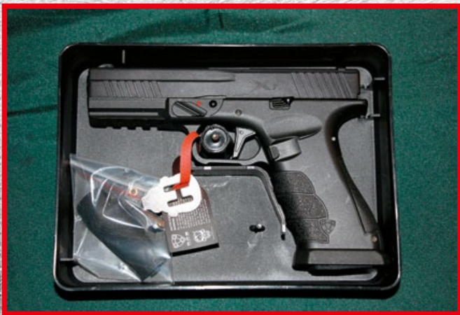
XTP 的開箱內容物，原廠多附一組較大尺寸的握把片。