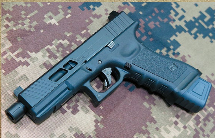
裝上 Dytac SLR G17 改套的 TM G17 手槍，堪稱是最完美組合。