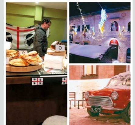
活動首日在這家餐廳大快朵頤、享用正宗的義大利美食。

2018 年 12 月的 30-31 日這兩天，除了迎接即將來到的跨年活動，同時對軍迷們來說更是一個特別的日期，因為也是首屆「尚武軍事文化祭」暨第五屆「1230 軍迷聚會」在湖南舉行的日子；行之有年的「1230 軍迷聚會」是