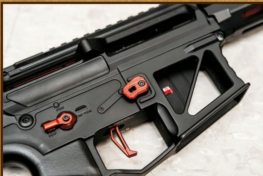
火控鍵以 Pew、Pew Pew 和 No Pew 等文字來代表單發、連發和保險，饒富趣味。