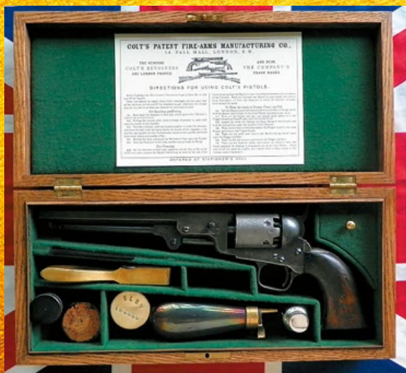
柯特 M1851 Navy 實銃，下方淚滴狀金屬罐為火藥盒。