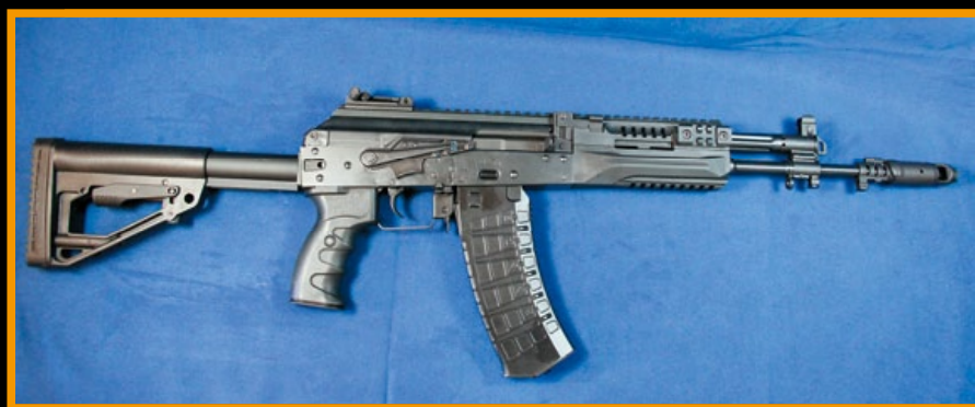
將摺疊式伸縮托完全伸展開後的 LCK-12。