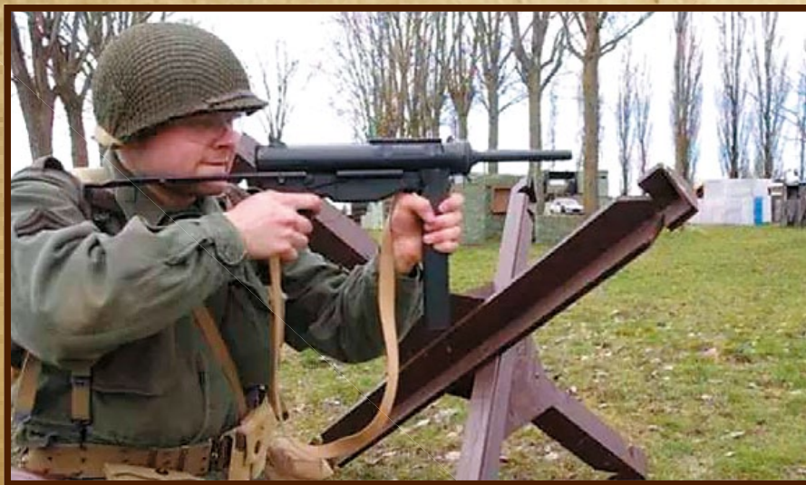
M3A1曾伴隨美軍征戰沙場，也贏得黃油槍的暱稱。(By Wikipedia)