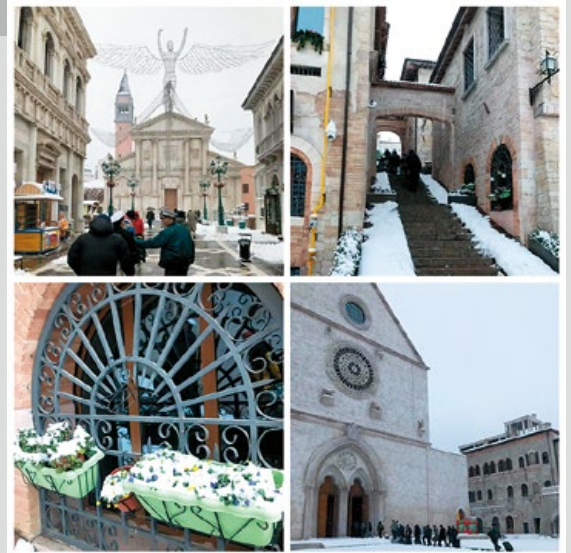
雖然天氣寒冷和交通不便，但是雪景也替活動增色不少。