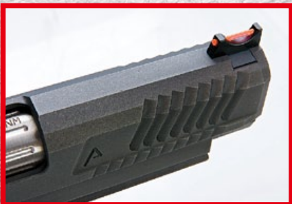
滑套前端配置紅色光纖準星。