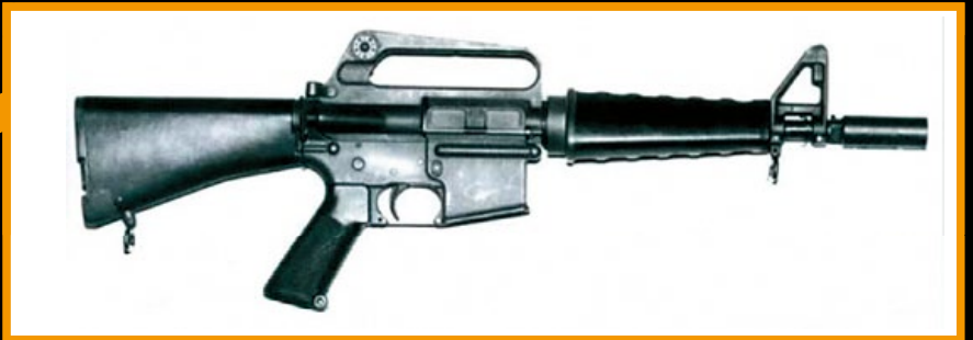
CAR-15 是越戰時專為美軍直升機組員等非第一線戰鬥人員所設計的卡賓槍。

美 軍在越戰期間開發了 M605A 卡賓槍，其槍管比 M16 短 5 吋而且沒有刺刀座，同時也取消了槍機助推器，但是增加了半自動、三點發和全自動的三種射擊模式，並於 1962 年配發給美國海軍海豹突擊隊 (SEALs Team) 使用，後來又開發了比 M605A 長度更短的 M607 (CAR-15) 卡賓槍，以提供給裝甲車乘員或直升機駕駛人員做為自衛武器；CAR-15 是柯特 (Colt) 公司第一款生產的卡賓槍，不但縮減