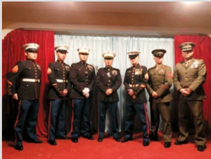
參加本屆活動的美國海軍陸戰隊玩家，威武形象讓人印象深刻。