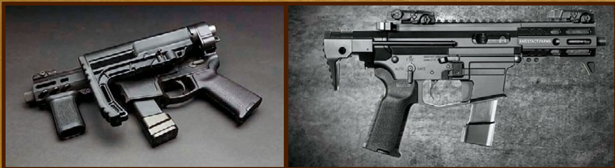
Shield Arms的SA-9(左)和Angstadt Arms的SCW-9均為採用 Glock手槍彈匣的AR手槍，兩者也都入選美軍緊緻型衝鋒槍標案。