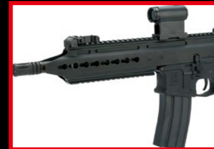
火控選擇及彈匣釋放鍵均為雙邊操作。