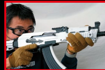
槍界名人塚達也 (Mach Sakai) 在其推特上介紹該槍。(By Twitter)

氣動步槍 (GBBR) 商品，來彌補市場上所欠缺的一塊，但在其他氣動步槍推出的十多年後，TM 的 GBB 步槍並未受到太多矚目，但一如該公司高層所言，TM 的產品主要以日本市場為主，海外市場銷售並非其主力，所以該公司的商品多少也和世界上的氣槍主流商品有脫軌，以這款白色風暴 AK 來說，或許正是以日本國內市場為主要考量。