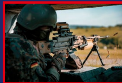
以前腳架進行陣地射擊的 MG4 機槍。(By Bundeswehr)