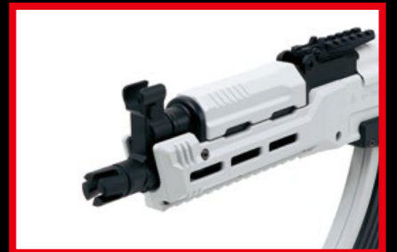
白色風暴專用的強化複合材質的護木。(By Unit13 shop)