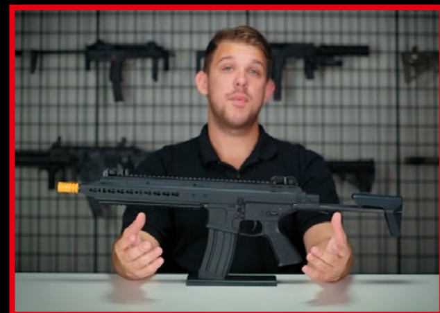
知名網站 Popular Airsoft 的版主推介 Scarab 頗具特色。