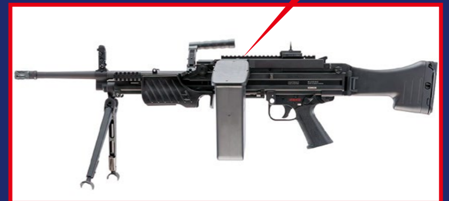
MG4 的外觀神似 M249，但更為輕巧，其彈箱容量為 4000 發。