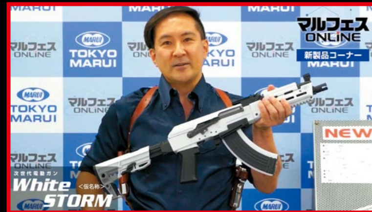
東京丸井 (TM) 公司在玩具展上發表白色風暴次世代 AK。