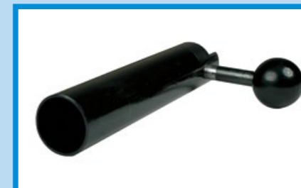
不鏽鋼製超大容量 (61cc) 氣缸。