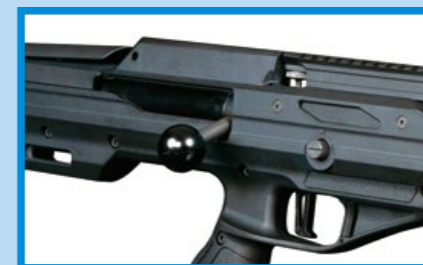
大型槍機拉柄的結構簡單牢固。