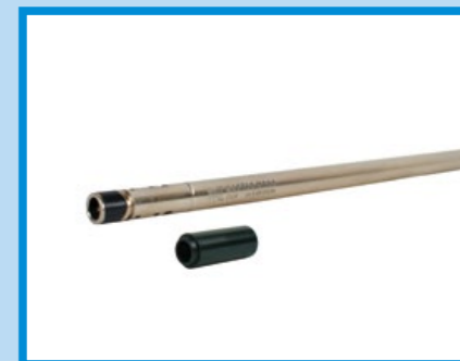
改套品牌神匠的 510mm 精密管和 R-Hop 皮 (MX-020)。