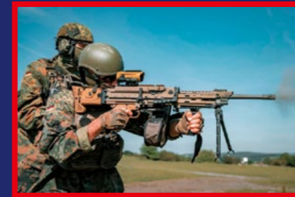
使用 MG4 機槍進行肩射的德國國防軍。(By Popular Airsoft)