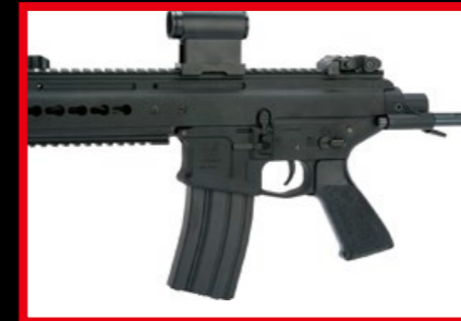
護木左、右兩側皆有 keymod 系統鎖孔。