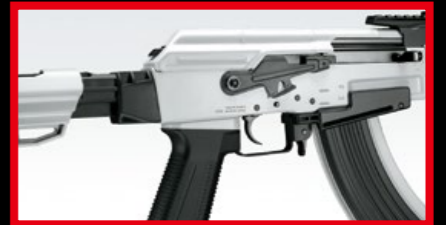
槍身採黑白配色，讓線條更為搶眼。