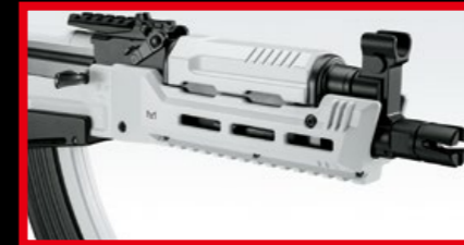
幾何線條的護木上有次世代商標。