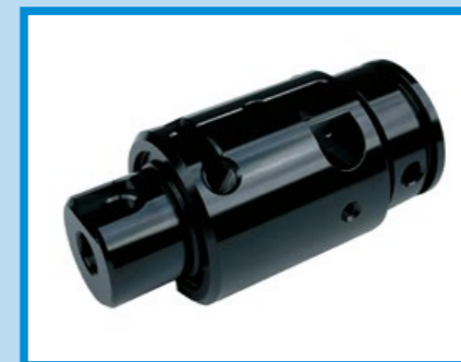
CNC 全刻一體式 Hop 座。