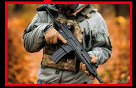
聖甲蟲 (Scarab) 是專為生存遊戲而設計的電槍。(By WMASG)