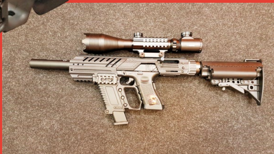
IWA 展出的樣槍是最新版本，加裝滅音器與海豹托。

G 23、G 34 和 G 35 等泛 G 系列槍型，其總長只比 G 系列手槍稍長些，在主體上方裝有一道直通式的標準寬軌皮卡汀尼軌道 (Mil-Std 1913 Picatinny Rail)，可供裝置折疊式準星 / 照門組或內紅點鏡等光學瞄具，Slong 在 IWA 展示的樣槍則裝有狙擊鏡，但實際上手槍 / 卡賓槍並不需要，純屬增添可看性罷了，另外，樣槍的防火帽可拆除，可加裝模型滅音器，配上加長型內管，不但讓原本手槍的射程和槍口初速增加，亦可用來執行隱密的特殊任務；MPG-G Kriss 套件還附贈死神鐮刀造型的“勾魂托”，托桿為是標準尺寸，也可以更換其它款式的戰術托，不過