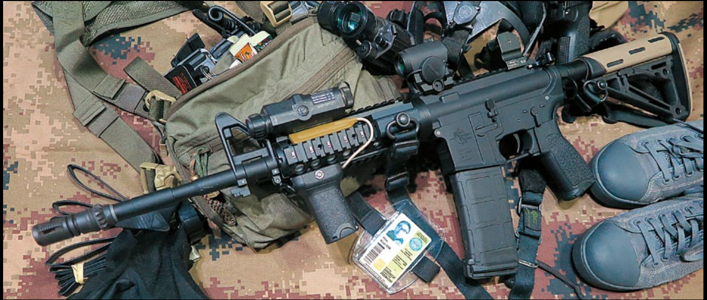
SA RRA M4A1(SA-E03)雖然扮相平淡無奇，但加上不同的戰術配件後，搖身一變為外觀時髦、功能齊全的潮槍