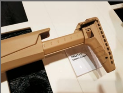
伸縮托可隨意調整長度。