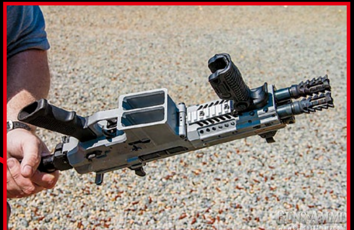
銀影公司於 2012 年開發的基利波 (Gilboa) 雙短管卡賓槍實銃，以雙彈匣供彈。