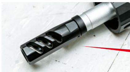
槍口配置F1原廠Dragon Slay式樣的防火帽。