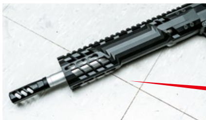
C7K 戰術護木中段以不同的幾何平面切割而成。