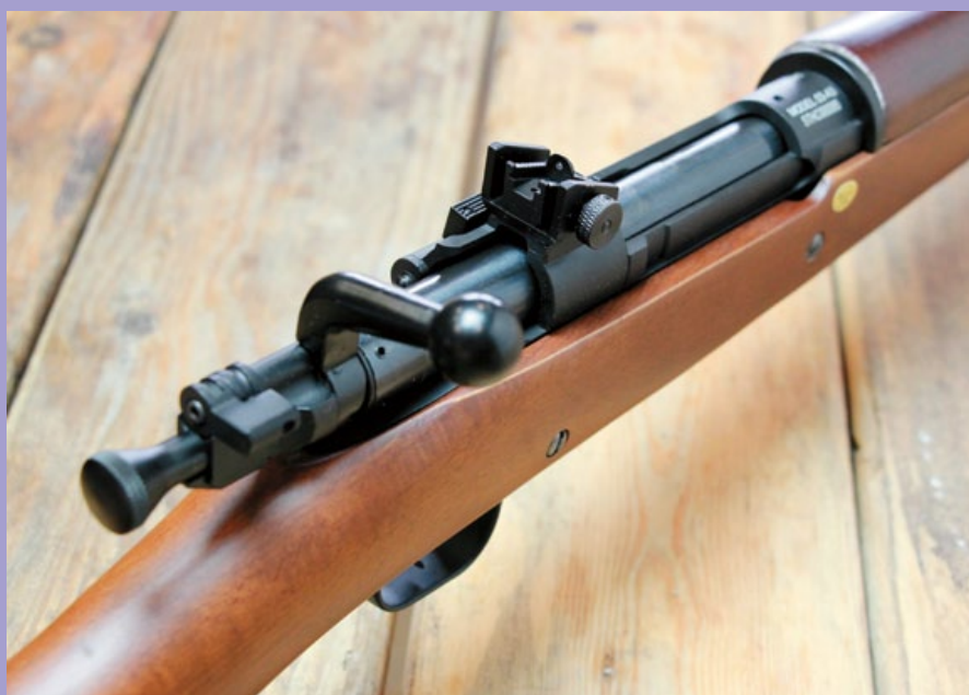
因為是手拉式單打一設定，故上膛時要多花點力氣。

M 1903 春田步槍於 1903 年時被美軍採用為制式步槍，除了春田 (Springfield) 兵工廠之外，還有岩島 (Rock Island) 兵工廠也生產此槍，到了美國參加第一次世界大戰後，總共約生產了 84 萬支 M1903 步槍，但軍隊在戰場上消耗量驚人，所以將英國恩菲爾德 (Enfield) P14 步槍改為與 M1903 相同的美規 .30-06 口徑，並重新命名為 M1917 步槍，以做為應急補充裝備之用，所以一般俗稱的“三零步槍”其實有兩種型號，但大多數還是以 M1903 為主；在二戰爆發前夕的 1938 年，美國開始配備半自動 M1 葛蘭特 (Garand) 步槍，但因構造遠比 M1903 複雜以致產量不足，因此部分原本被封存的