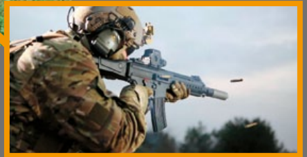
HK433 的測試結果讓人滿意，未來成為德軍新型制式步槍的機率呼聲頗高。