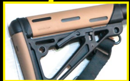
配備流行於特戰團的Hogue伸縮托，外型酷似Magpul的CTW伸縮托，腮貼及托底部都有防護膠墊。