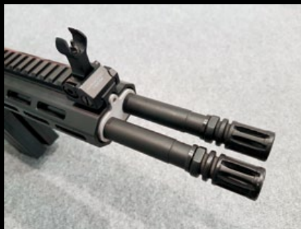
CA DT-4 的雙槍管有如雙龍出海，火力勢必旺盛。