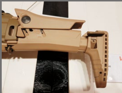
槍托上的腮貼亦可調整高度。