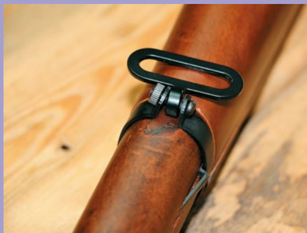
連槍背帶環等小零件都是鋼製。

M 1903 春田步槍於 1903 年時被美軍採用為制式步槍，除了春田 (Springfield) 兵工廠之外，還有岩島 (Rock Island) 兵工廠也生產此槍，到了美國參加第一次世界大戰後，總共約生產了 84 萬支 M1903 步槍，但軍隊在戰場上消耗量驚人，所以將英國恩菲爾德 (Enfield) P14 步槍改為與 M1903 相同的美規 .30-06 口徑，並重新命名為 M1917 步槍，以做為應急補充裝備之用，所以一般俗稱的“三零步槍”其實有兩種型號，但大多數還是以 M1903 為主；在二戰爆發前夕的 1938 年，美國開始配備半自動 M1 葛蘭特 (Garand) 步槍，但因構造遠比 M1903 複雜以致產量不足，因此部分原本被封存的