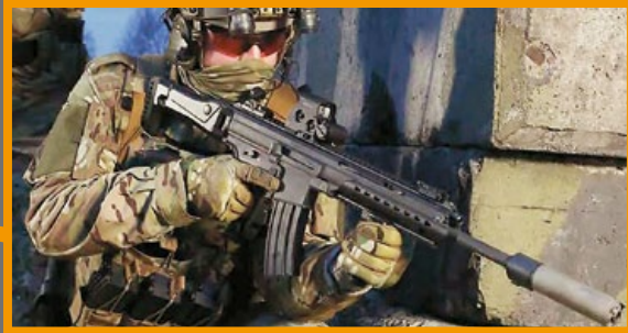
HK433 可加裝滅音器，適合特戰任務。