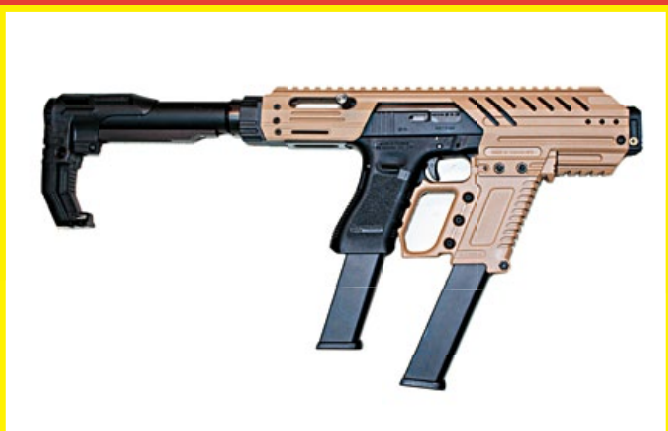
MPG-G Kriss 套件的最初版本，配備鐮刀造型的“勾魂托”。