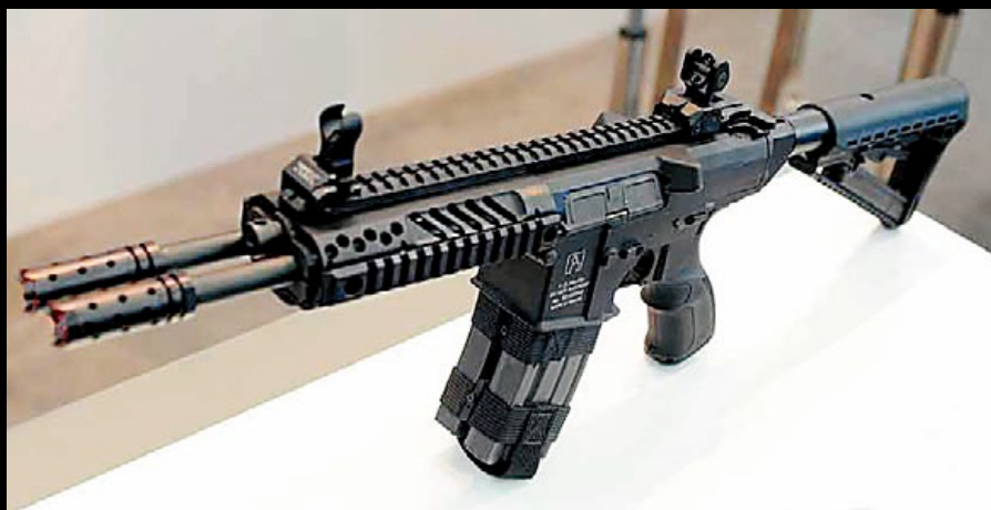
基爾波蛇 (Gilboa Snak) 雙管步槍實銃是 CA DT-4 的開發藍本。

幾位退役的以色列國防軍士兵和警察在 1995 年聯手組建了銀影 (Silver Shadow) 先進安全系統公司，原本的業務是保全培訓與跟保全業務有關的新品開發、生產和銷售，當然也包括了自身的槍械品牌，2011 年該公司以自製的基爾波 (Gilboa) 短管卡賓槍 (Assault Pistol Rifle, APR) 為基礎，開發的一款名為“基爾波蛇”的 (Gilbor Snake) 雙管突擊步槍，並於 2012 年的歐洲國際防務展 (Eurosatory) 中以“新概念武器” (NCW) 之名發佈，然而剛開始並未受到特別的關注，直到韓國電子遊戲《絕對武力 Online》 (Counter-Strike Online) 於 2014 年 11 月初推出