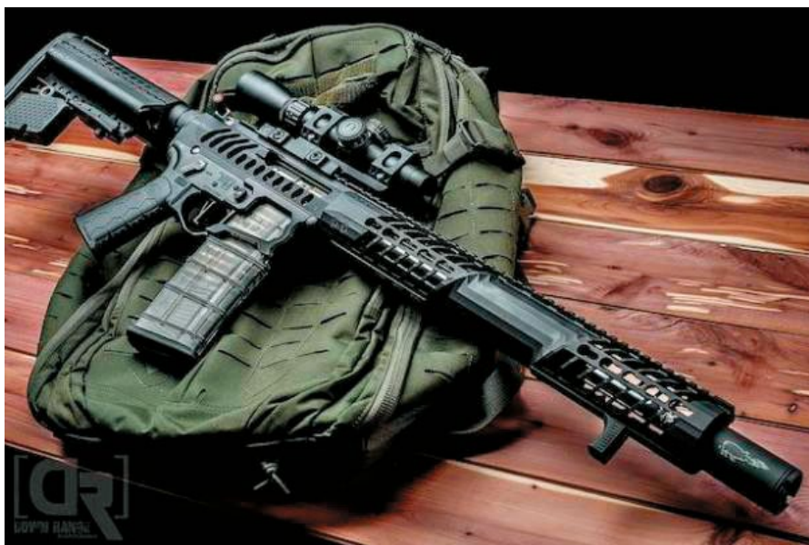
F1 Firearms精心打造的AR-15實銃。

APS與 EMG去年7月聯手推出的 BDR-15 3G 是 F1 Firearms 首度授權玩具槍廠生產的電槍(AEG)，而這次推出的 F1 Firearms SBR則是 BDR-15 3G 的短管步槍(SBR)版本，該槍採用跟 BDR-15 3G相同的上、下機匣，同