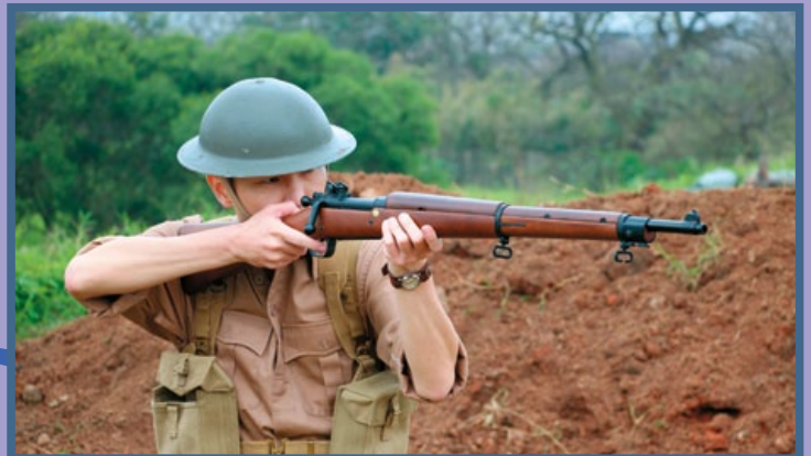
M1903 是美軍橫跨一、二次世界大戰的知名步槍，國軍在抗戰時亦有配備。