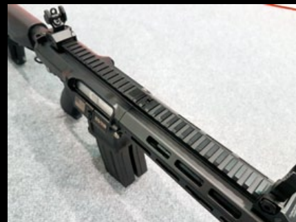
機匣上方的全通式戰術導軌，可串連安裝光學瞄具。