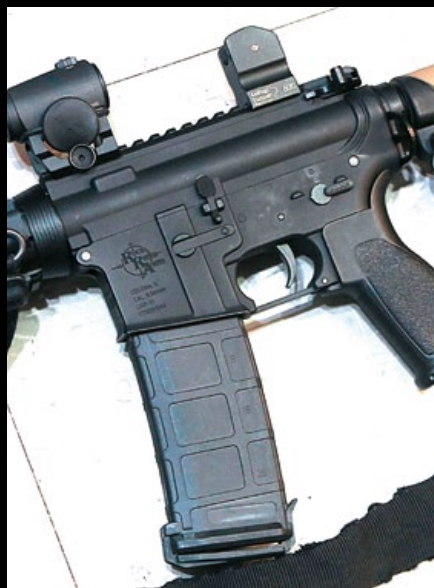
全槍採烤漆處理，彈匣井上方刻有RRA商標，並加裝T1紅點瞄具和LaRue款BUIS後照門。

其 實本篇的誕生有點微妙，雖說是應SA的要求再作強化報導，但其實是筆者自投羅網主動提出這個撰稿要求，原因是難得有新的歐陸玩具槍廠進軍亞洲市場，而且選擇戰鬥王作為首要的宣傳媒體，因此為了加深亞洲讀者對SA品牌的認知，筆者有一種自覺和野心，要用自己的語言和視野再表現一次Specna Arms的產品特色；其次是這次報導的對象是一支基本款的M4A1(SA稱之為Edge系列RRA SA-E03)，讓筆者更為亢奮，因為身為生存遊戲媒體超過15年，見過的漂亮名槍也實在夠多，要用這些好槍出華麗的報導並非難事，但要用普通的M4A1寫出一篇可讀性高