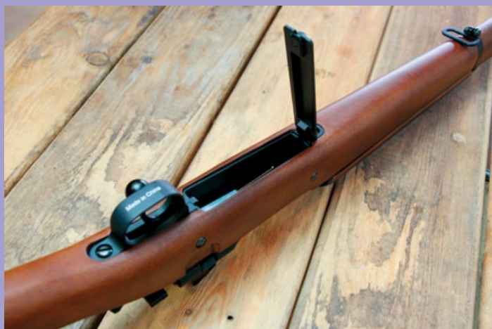
容量 25 發的彈匣裝在槍身下方。