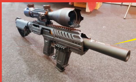
槍口加裝模型滅音器，更添特戰風格。