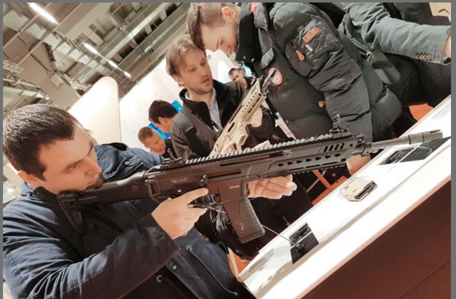
國民眾在今年 Enforce Tac 展覽中試瞄 HK433。

採用短行程活塞導氣、旋轉式槍機運作的 HK433，在外觀和設計上跟系出同門的 G36、HK416 和雷明頓 (Remington) ACR 及 FN SCAR 步槍有頗多相似之處，其射擊模式選擇鍵 (火控組) 和彈匣式放鍵均可雙邊操作，對左、右撇子均是一大利多，習慣操作 AR 系列或 G36 式樣步槍的士兵可以輕鬆上手，實用性能明顯增加；HK433