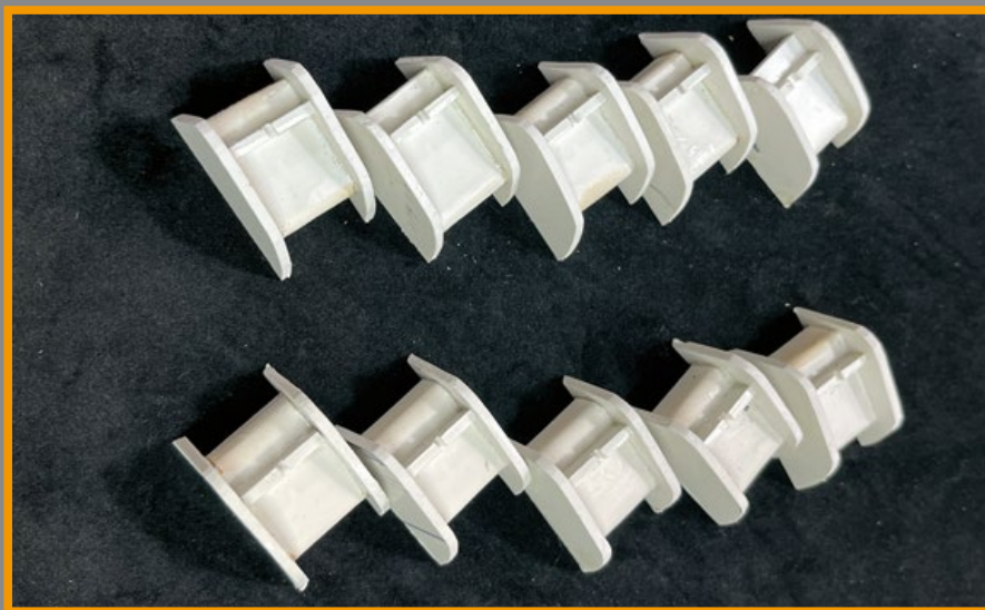
以 3D 列印手工打磨製成的照門。