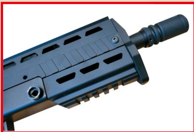
以 CNC 鋁合金與鋼材製成的一體成形上機匣。