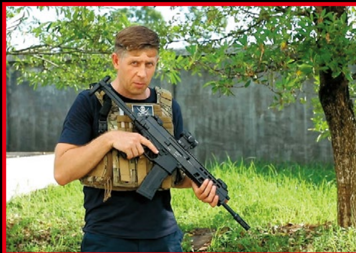
APC556 造型時髦流暢，亦適合加裝紅點鏡。