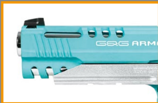
滑套前段採鏤空設計，增加視覺感受。