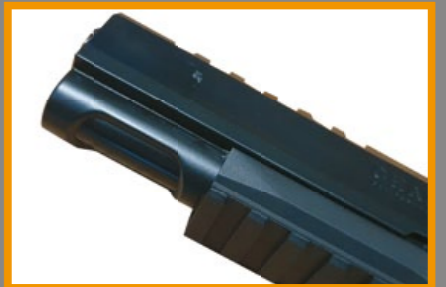
能裝上槍燈或雷指器的小段戰術底軌。