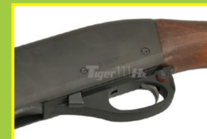
保險位於扳機護弓後端上方。