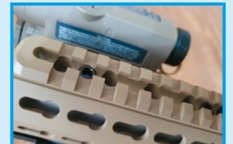
魚骨護木上方裝有全通式戰術軌道。

7.62mm 款式的快拆滅音器，不但安裝確實，而且色澤跟槍身一致，加上位於機匣上方的全通式軍規皮卡汀尼 (Picatinny) 軌道，可供安裝各類光學瞄具，可幫助玩家節省不少改裝功夫；整體來說，ASG Mk13 Mod7 不但外觀