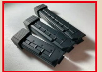
隨槍附贈短、中、長三種不同容量(65~110發)的無聲彈匣。