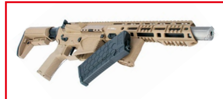
表面有蜂巢狀格紋的 120 發中容量彈匣。

錢即可擁有，不過最值得介紹的，還是香港 Dytac 代工生產的“輕量化適應性軌道系統” (Adaptive Rail System Lite，簡稱 ARS-L) 護木，此護木結合了 M1913 皮卡汀尼軌道 (Picatinny Rail) 的功能性和馬蓋普 (Magpul) MLOK 系統的多樣性，不但重量輕且質地堅固，玩家可按照自身需求來自行安裝各種戰術配件，加上該槍配備 9 吋 (22.9cm) 長度的短管，因此造型緊緻結實，非常適合近年來生存遊戲盛行的近距離作戰 (CQB)。