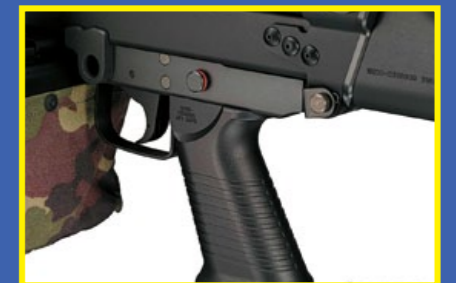
刻有防滑紋路的握把，保險位於其上方。