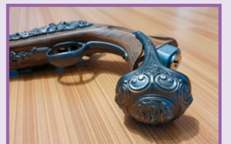
拔下底蓋即可見瓦斯填充口。