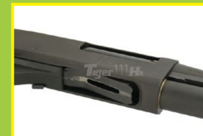
掀開彈艙底板，即可裝填霰彈。