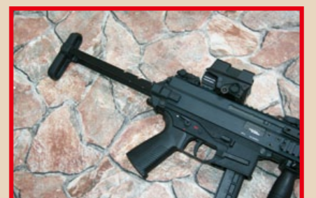
可三段調整長度的伸縮托。

說，APC9K 是專為軍警設計的執法用模組化衝鋒槍；APC9 系列有多種不同的下槍身與槍托配置方式，以便對應不同口徑的彈藥，而 APC9K 之所以會在美軍標案中勝出，主因便在於該槍射擊的 9mm 口徑子彈，在現代近距離戰鬥(CQB)中的效能較優，而且威力不易傷及無辜；未來 APC9K 將用於防衛美軍指揮中心據點、保護高級將領和要員(VIP)和憲兵(MP)執法之用。