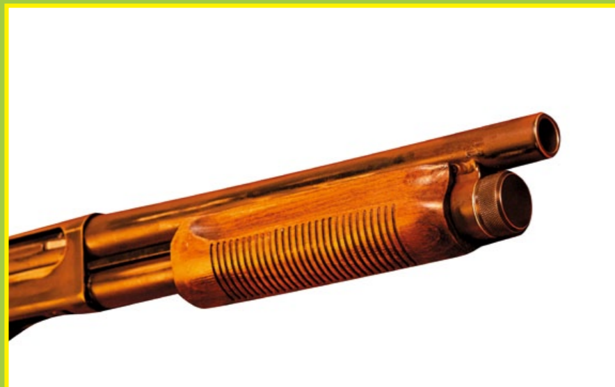
護木表面施以手工防滑處理，上彈擊發一氣呵成。