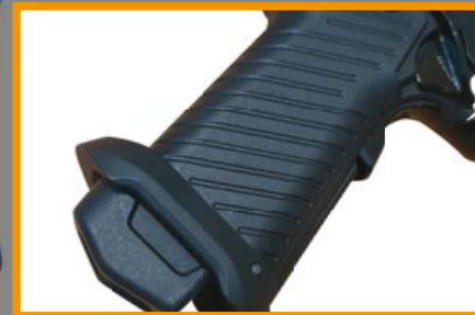
斜紋握把與加大彈匣井。