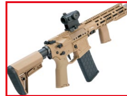
ARS-L 護木上端裝有直通式軌道，可加裝復仇者 (Avengers) T1 紅點鏡。