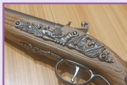
槍身表面鑲嵌細緻的金屬雕花圖案。