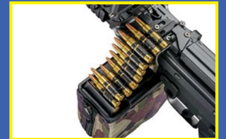
附裝飾彈鍊的 1000 發彈箱。

槍在發售後沒多久，便出現彈鼓固定燕尾導片破損的情況，幸好 TM 已即時補償，買家可將故障導片寄回 TM 更換即可，欲知更多相關訊息，請瀏覽東京丸井官網 ( www.tokyo-marui.co.jp )。