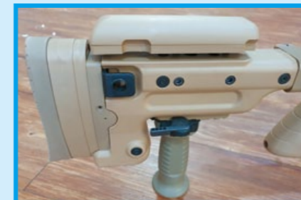
槍托膠貼及托底墊可分別調整高度和長度。