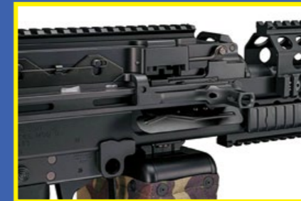
具備上膛功能的槍機拉柄，但射擊時不會連動。