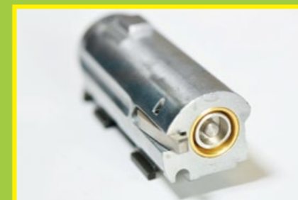
撞針上加裝外圍，無法打擊制式霰彈底火。