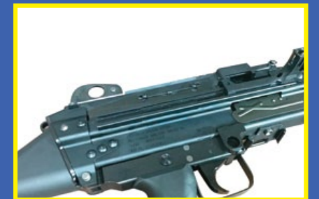
握把上方槍身有仿實銃完整刻印。