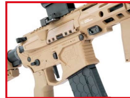
槍身右側彈匣井上方刻有凸顯身價的 F4 原廠印記。