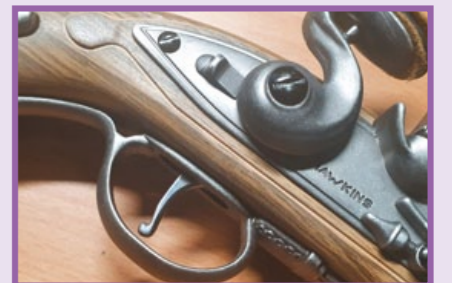
金屬材質製成的扳機及護弓。