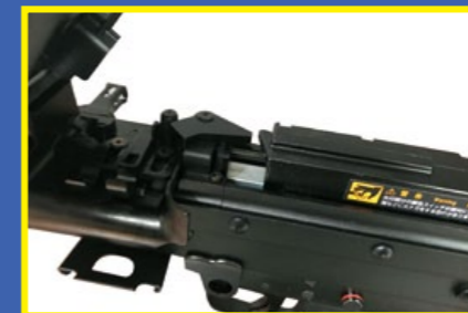
打開機匣蓋即可一探著名的次世代後座力系統 (NGRS)。