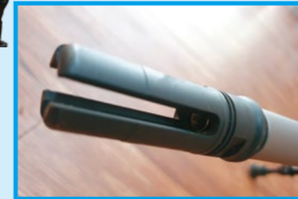
跟實銃一樣的四叉式防火帽。

ASG 隨槍附贈貼紙、壓點、三鐵、Hop 皮和 Hop 座，而且首批上市發售的 Mk13 Mod7 還贈送前腳架，至於狙擊鏡、鏡座、槍托腳架、雷指器和熱顯像儀則需自行購買，家還可選購