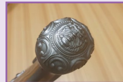
底蓋表面鑲有喬治華盛頓頭像。

該槍的擊發過程簡易，先將擊錘拉桿往後扳，然後將保險拉桿朝後固定並上膛，擊扣扳機便可射出 BB 彈；瓦