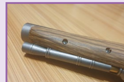
推彈條其實是容納 21 顆 BB 彈的彈匣。