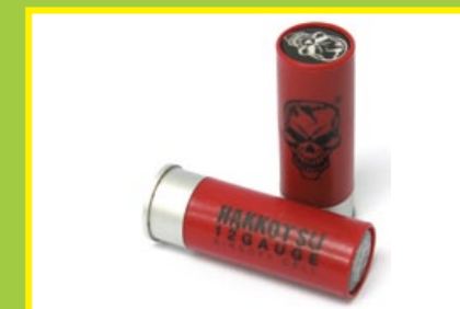
充氣式 CO2/ 瓦斯霰彈殼，每發內裝三顆 BB 彈。