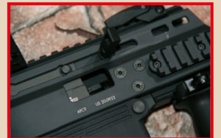
假槍機後定即可見 Hop-up 調整轉盤。