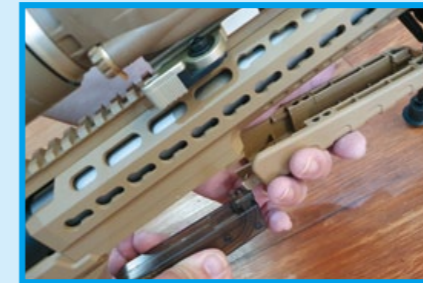
取下護蓋即可見隱藏於內的 VSR-10 式樣彈匣。