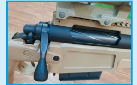
槍機行程短且好拉，表面刻有仿真螺旋溝槽。