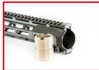
Dytac 代工的輕量化適應性軌道系統 (ARS-L) 鋁質護木。