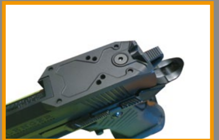
滑套末端裝有複合式鏡座，可供加裝微型紅點鏡。

項口碑不錯，所以上、下槍身的緊密度頗佳，以其價位來說，算是 CP 質挺好的產品了；剛拿到這把 Challenger 時，小編發現其握把與 STI Combat Master 的握感類似，只不過後者是以手工製成，而 Challenger 則採用較簡單的環形凹紋設計，不過就功能而言，其實差異不大；挑戰者的彈匣井 (Magwell) 增寬加大，有助於快速更換彈匣，加上槍口內刻 14mm 逆牙螺紋，裝上轉接頭即可加裝減音器，讓挑戰者在競技導向外，更增添些許戰術風格；跟一般的 M1911