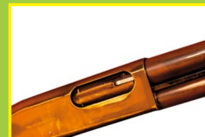
槍身表面經過戰損強化處理，增添滄桑感。