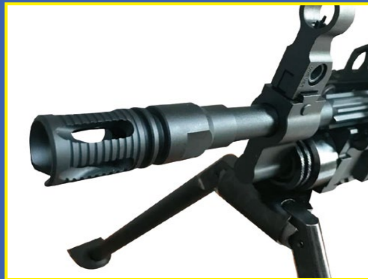
防火帽拆除後可換裝 KAC 減音器。