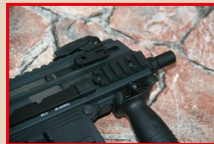
槍身前端下方的短軌道可用來加裝前握把。

在2020年4月贏得美國陸軍“緊緻便攜武器”(SCW)標案的 APC9K 實銃，是一款由瑞士布魯格索麥(B&T)美國分公司生產的緊緻型衝鋒槍，其英文名稱中的“APC”，是“先進警用卡賓槍”(Advanced Police Carbine)的縮寫，“9”代表射擊 9×19mm 子彈，而“K”則代表德文“緊緻”(Kompact)的意思，換句話