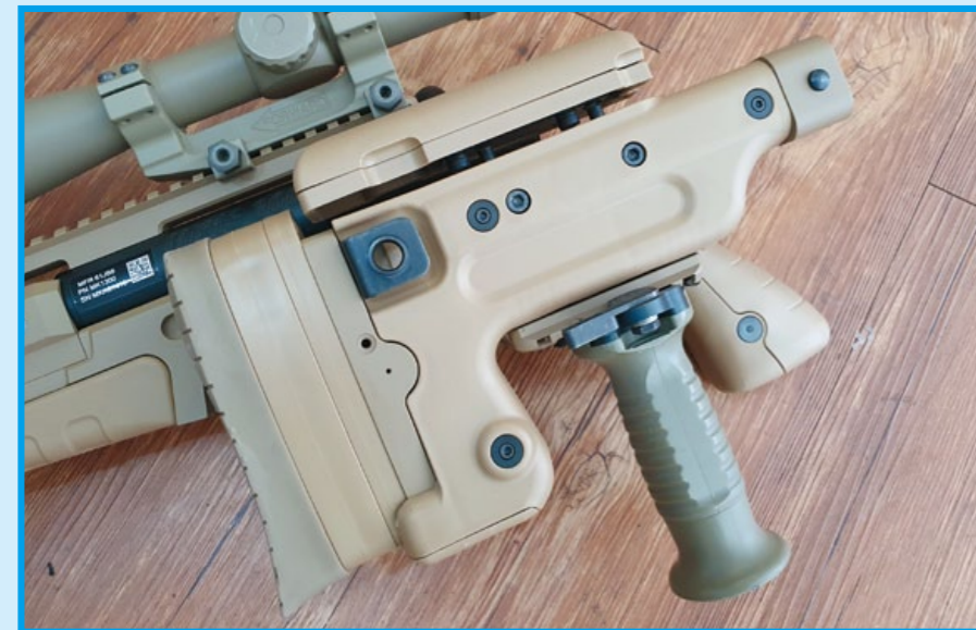
槍托可向左摺疊，下方軌道可供加裝握把式支架。