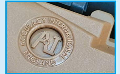
槍身表面刻有 AI 原廠授權的廠徽。