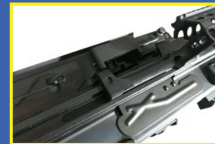
沖壓合金槍身結構緊固、質感提升。

TM MK46 Mod 0 的全槍配備包括日本零售價 148,000 日圓，換算台幣約 42,500 元，以市場行情來說算是偏高，不過 TM 也沒虧待願意付出高價的死忠粉絲，不但隨槍附贈雙腳架、1000 發裝彈箱和 11 發的仿真彈鍊，還加送一只由台灣翔穩 (J-Tech) 精心打造的專用槍箱，堪稱是誠意滿點，值得注意的是該