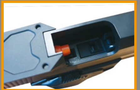
氣嘴及內部零件均可通用馬牌 (TM) 原廠貨。

裝競技用微型紅點鏡，購入後不加裝的人應該也不多；滑套的材質有兩種不同規格，分別是塑料滑套 (BLE-007-PB) 和金屬滑套 (BLE-007-SB)，玩家可自行挑選，另外在下槍身前端配置能裝上槍燈或雷指器的小段戰術底軌，再加上輕量化鏤空扳機、加大彈匣井 (Magwell) 和表面刻有防滑紋路的握把，在在說明了挑戰者是一把突破傳統、競技導向的 Hi-Capa 式樣氣動手槍。