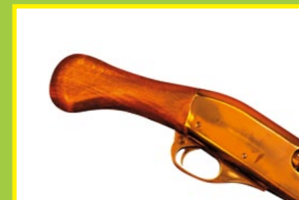
原木握把經過舊化，色澤迷人、握持就手。