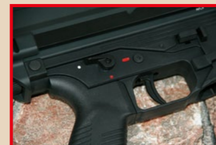
射擊模式選擇鍵(火控組)亦可雙邊操作。