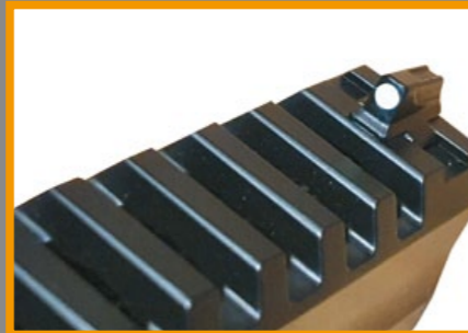
在滑套及照門後端刻有細微凹槽，可減少瞄準時的反光。

一芝軒 (ICS) 子品牌黑豹眼 (BLE) 即將推出的挑戰者 (Challenger)，是一支擁有 Hi-Capa 優良血統的競技取向氣動 (GBB) 手槍，從外觀上即可看出該槍是以經典 M1911 Hi-Capa 為藍本研發而成，舉凡海狸尾握把保險、擊錘、雙邊拇指保險和滑套後定鍵等都保有鮮明的 M1911 特徵，但是增添了現代感的競技風格，像類似 STI DVC Omni-RMR 式樣的鏤空滑套就頗具特色，表面以霧黑色處理，適合玩家自行拋光和舊化，讓槍身的金屬質感能夠呈現使用過後的不同對比度；滑套左側表面刻有挑戰者英文字樣，上方前、後端裝有機械式夜光準星與照門，儘管不是氬氣發光管等級的高價位補品，但從玩家立場來看，這樣反而可以降低售價，所以未嘗不是件好事，更何況該槍早已在滑套末端裝上複合式紅點鏡座，可供 Pro 級的玩家加