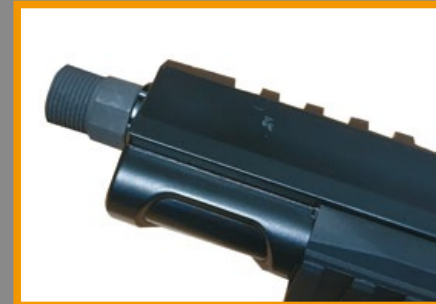
平頂三邊裁切 (Tri-cut) 滑套是 War Hawk 的最大特色。