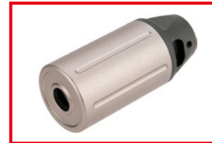
內建 Xcortech XT301 迷你發光器的 Dytac 減音器式樣防火帽。