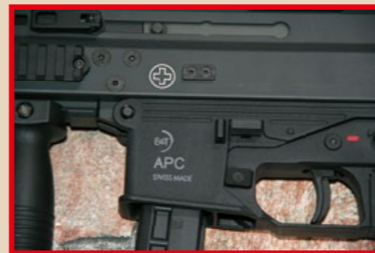
位於槍身右側的 B&T 原廠標誌及型號。