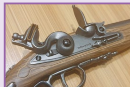
擊錘桿與保險桿開啟的情形。

斯充填過程跟一般 GBB 手槍相同，灌瓦斯前要先拔下握把末端的底蓋 (Butt Cap)，注意瓦斯氣瓶與填充口要保持垂直，再將底蓋裝上，即可開始射擊；根據任擎的慣例，此槍日後應該還會推出 4.5mm 口徑和 CO2 版本的不同槍型；