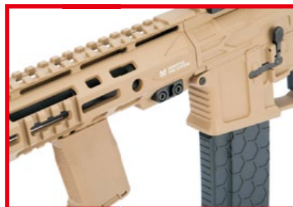
裝設在護木下方的粗短垂直式前握把。

F4-15 PDW 因為有原廠授權，所以外觀充分擬真，鋁製機匣側面刻有實銃印記，上端則有一條直通式軌道，可供加裝各種光學瞄具 (樣槍配備的是復仇者 T1 紅點鏡)，其他諸如 EMG 的勇敢 (Bravo) 握把、粗短垂直式前握把、可五段調整長度的三角洲 (Delta) 伸縮托和內建 Xcortech XT301 迷你發光器 (Mini Tracer) 的 Dytac 防火帽，都是 F4-15 PDW 配備的好料，玩家不必多花